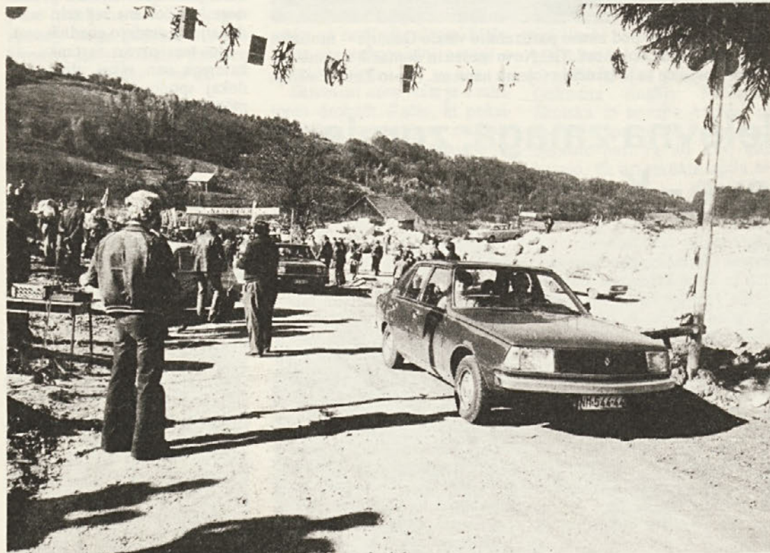
Cesta je odprta, prvi gostje so se podali po njej do Krvavega kamna. Gospodarstvu, turizmu in izletništvu, oddihu delovnih ljudi in nadaljnjemu razvoju Podgorja odpira nova cesta v osrčje Gorjancev dolgo pričakovane obete in neštete želje, da bi se tudi tu obrnilo na bolje... (Foto Janez Pavlin).