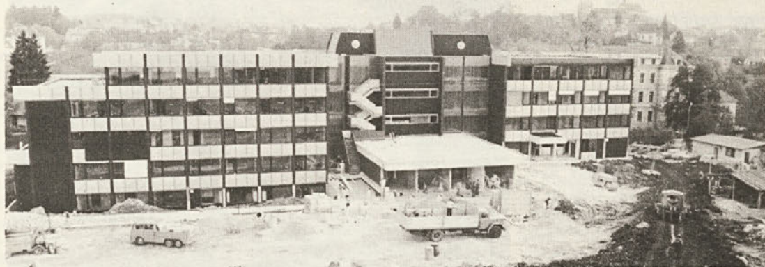
Pogled na novi zdravstveni dom in zaključna zunanja dela; slovesno so ga odprli 29. oktobra. Za delovne ljudi Novega mesta in širše okolice je to ena izmed velikih, dolgo pričakovanih zmag...