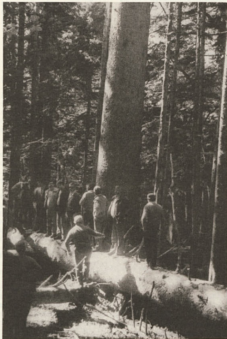
S strokovne ekskurzije DIT dolenjskih gozdarjev v pragozdu Peručice v jugovzhodni Bosni oktobra 1979: ob mogočni smreki. (Foto in tekst ing. Jože Kure).

Večina med njimi se odloči za nadaljnje šolanje na srednjih šolah. Polovica osnovnošolcev se vpiše na poklicne šole, tretjina na tehnične in druge strokovne šole, petina pa na gimnazije. Na poklicnih šolah ostajajo mesta, predvidena za novince, še vedno prazna; lani je bilo takih mest 16 odst., druge srednje šole pa so bile prezasedene. Na slovenskih srednjih šolah je zadnja leta vsakič po tri in pol odstotka več učencev. V šol. letu 1977/78 se je na teh šolah izobraževalo 84.226 učencev ali kar 42 % v če kot pred desetimi leti.