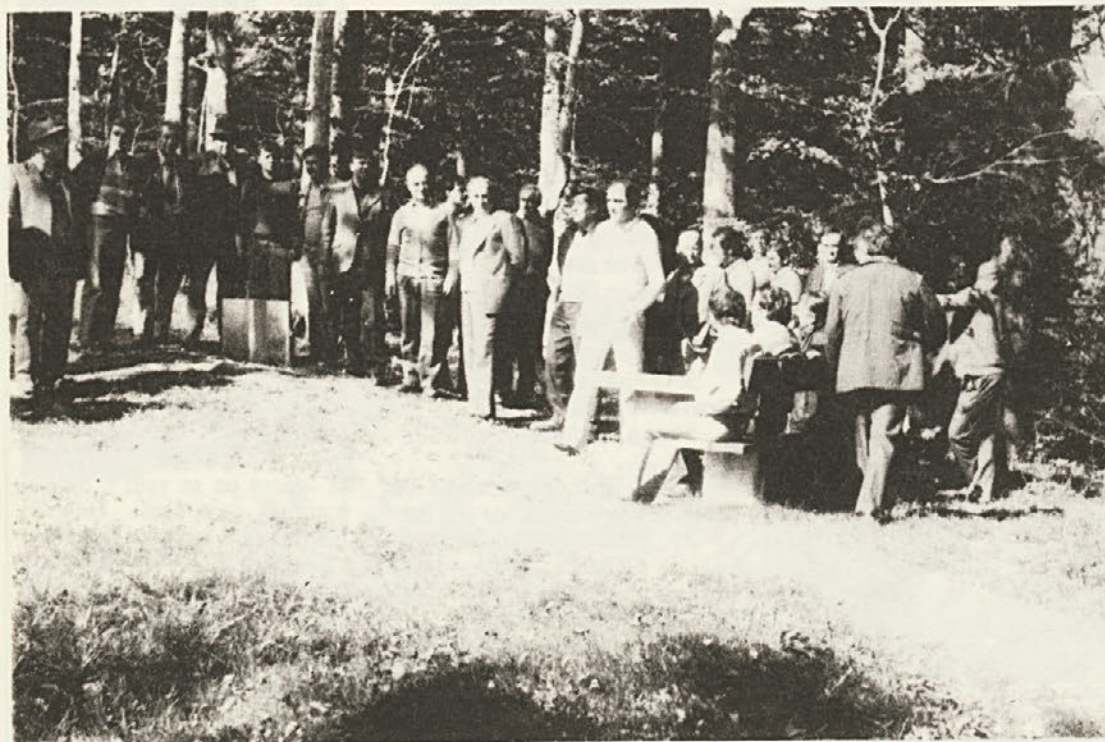
Strokovna ekskurzija DIT dolenskih gozdarjev na območju nacionalnega parka Tjentište, kjer se je v drugi svetovni vojni v V. sovražni ofenzivi odigrala epopeja jugoslovanskih narodov, imenovana „Bitka na Sutjeski“. Na sliki mesto, kjer je bilo v tej ofenzivi ranjen v roko od delca letalske bombe tovariš Tito.

Med obedom smo se pogovarjali, opazovali vrhove gora in s prvimi jesenskimi barvami obarvane gozdove. Visoko v steni tik pred nami je bila v skalo vsekana trasa nekdanje „koturače“, to je naprava za vagončke na ozkih tračnicah, ki so jih vlekli konji. „Spravilo je moralo biti zelo drago in zelo pogumni ljudje“ smo spoznali. Pozno popoldan smo se vrnili po isti cesti