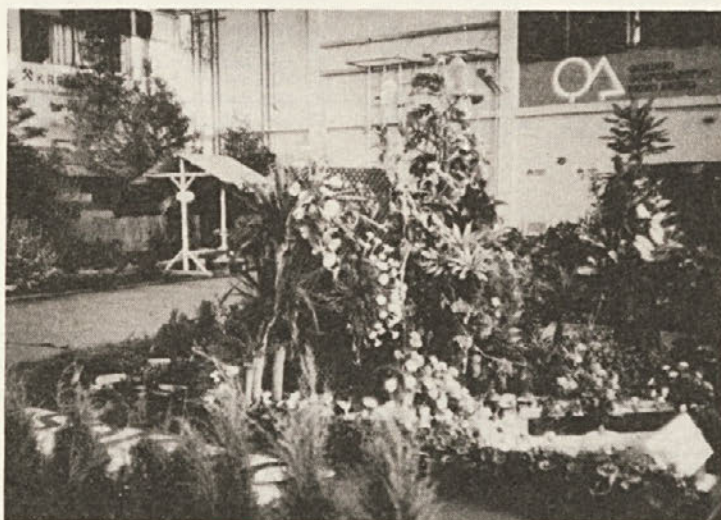
Tudi letos je bila razstava „Gozd, gobe, cvetje“ zelo dobro obiskana. Na sliki: vrtnarski kotiček.

hodke in skupno porabo bo stopil v veljavo 3. 11. 1979, uporabljali pa ga bomo od 1. 1. 1980, ker bomo do takrat imeli sprejet tudi pravilnik o razvidu del oziroma nalog in druge