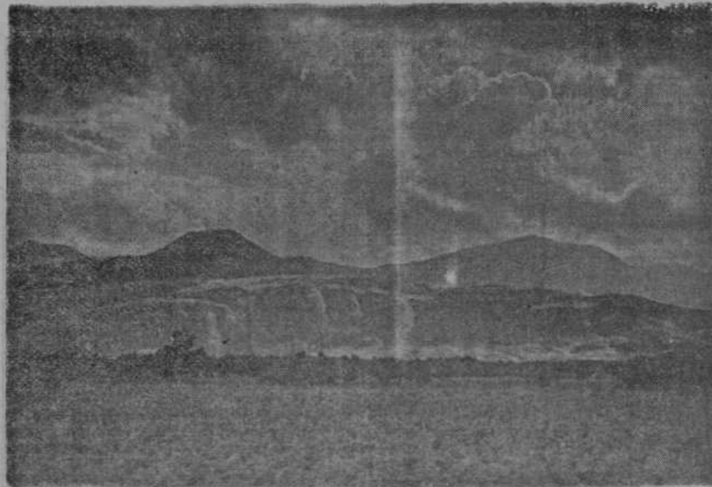
Pokrajina, po kateri prodirajo Italijani v Grčičje