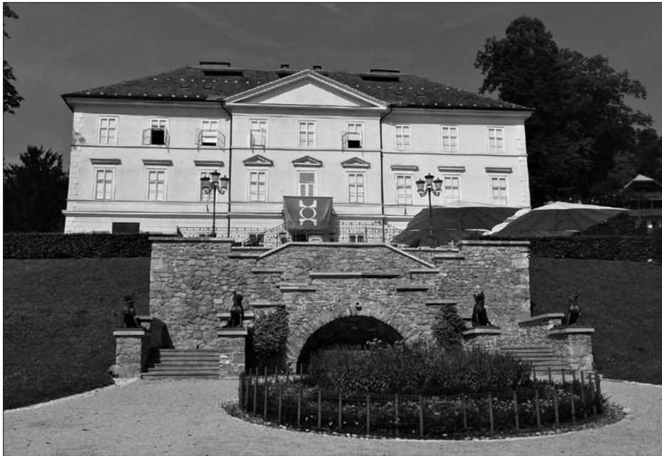
Ljubljana, Tivolski двореc s stopniščem.

Ob vznožju dvoramnega terasastega stopnišča t. i. Tivolskega gradu (nekdanj graščina Podturn), 1 dvorca v istoimenskem ljubljanskem parku, na masivnih litoželeznih, 9 cm visokih pravokotnih podstavkih sedijo štirje litoželezni psi pasme molos, po dva na vsaki strani, njihova višina je ok. 114–117 cm. 2 Gre za odlitke iz 2. polovice 19. stoletja, in sicer dveh zrcalno obrnjenih modelov, ki se razlikujeta le v zasuku glave v levo oziroma desno navzgor in v postavitvi zadnjih nog. Kratkodlaki pasji trup je poudarjeno mišičast, na predelu prsnega koša pa so značilne gube. Daljše dlake okoli vratu z ovratnico in izrazite šape se navezujejo na ikonografijo leva, kralja živali. Rep je košat, ušesa dvignjena, v rahlo odprtih gobcih ni videti jezikov. Pripisani so nemško-avstrijskemu historicističnemu kiparju Antonu Dominiku von Fernkornu. Članek po krajši uvodni predstavitvi železolarstva v Evropi nasploh in posebno umetniškega liva sledi vzorom za obravnavane molose, od helenističnega prototipa do poznejših antičnih kopij in zlasti novejših iz 19. stoletja, ter podvomi v doslej veljavno avtorstvo modela zanje in v izvor ulitkov v dunajskih livarnah.