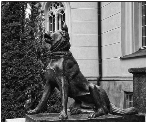
Otok Rügen, lovski dvorec Granitz, litoželezni molos pri vhodnem stopnišču, 1838–1846.