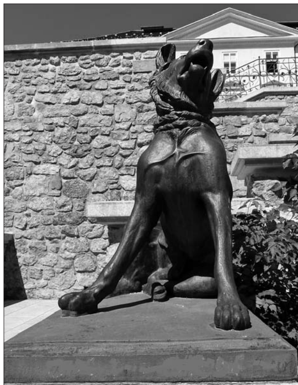
Ljubljana, Tivoli, litoželezni molos, drugi z leve ob pogledu proti dvorcu.