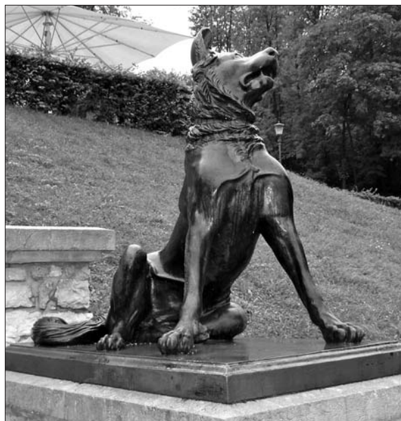
Ljubljana, Tivoli, litoželezni molos, četrti z leve ob pogledu proti dvorcu.

in ekspresivnosti kasneje reproduciran v dekorativne namene, lahko tudi kot par. 36