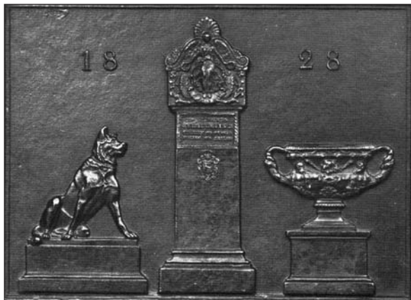
Stadtuseum Berlin, novoletna plaketa iz leta 1828 (Schmidt, Der preussische Eisenkunstguss , str. 91, sl. 80).

no napravil repliko naravne velikosti po molosih iz Uffizijev, ulil pa jo je Wilhelm Hopfgarten. 44 Replika je bila leta 1828 razstavljena na razstavi kraljeve akademije ( Königliche Akademie der bildenden Künste und mechanischen Wissenschaften ) v Berlinu, nato pa je prišla v kraljevo zbirko. 45 Kalide je sprva obiskoval rudarsko šolo v rojstnem kraju Chorzów (nem. Königshütte), v letih 1817–1819 se je najverjetneje učil v kraljevi livarni v Gliwica. Potem se je preselil v Berlin, delal v ateljeju Johanna Gottfrieda Schadowa in istočasno v tamkajšnji livarni, po dveh letih pa je odšel h kiparju Christianu Danielu Rauchu. Odlikoval se je predvsem kot animalist. 46 Na mladega umetnika je imel velik vpliv modelarski mojster Wilhelm August Stirlasky, ki je prišel v Berlin leta 1805, prav tako iz Gliwic. Odlitek molosa po Kalidejevem modelu lahko še danes vidimo ob stavbi nekdanje berlinske livarne na Invalidenstrasse. 47 Pes je bil prava uspešnica in je upodobljen tudi na livarniški novoletni plaketi iz leta 1828, primerek katere