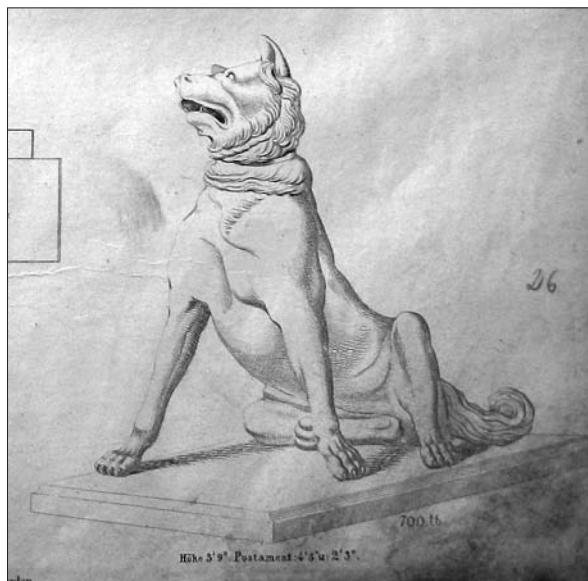
Moravský zemský archiv v Brně, Salmov katalog, Molos 1 in molos 2, po sredini 19. stoletja.