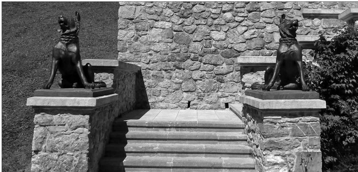
Ljubljana, Tivoli, par molosov na stopnišču.

oblik in formalno preprostost. 6 Skupaj s Christianom Petrom Wilhelmom Beuthom (1781–1853) je začel pod vplivom francoskih in angleških vzorčnih knjig leta 1821 izdajati Vorbilder für Fabrikanten und Handwerker , zbirko modelov in vzorcev za manufakture in rokodelce – veliko jih je prispeval tudi sam. 7 Schinkel je izredno vplival na pomen in vpliv pruskih livarn, podobno tudi Johann Gottfried Schadow (1764–1850), avtor slavne brandenburške kvadrige v Berlinu, in drugi umetniki, v prvi vrsti kiparji. 8