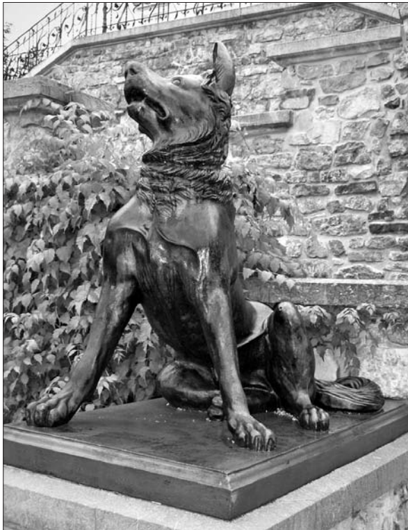
Ljubljana, Tivoli, litoželezni molos, tretji z leve ob pogledu proti dvorcu.

paru molosov na stopnišču lovskega dvorca v kraju Granitz 52 na otoku Rügen na severovzhodu Nemčije, ki sta bila tja postavljena med letoma 1838 in 1846, je livarna izdelovala tudi par, pri čemer en pes gleda v svojo levo in drugi v svojo desno stran, torej gre za zrcalno podobo; ta par se razen po merah v ničemer ne razlikuje od ljubljanskih dveh parov. Istočasno so izdelovali tudi kipece firenških molosov v funkciji pismenskih obtežilnikov. 53