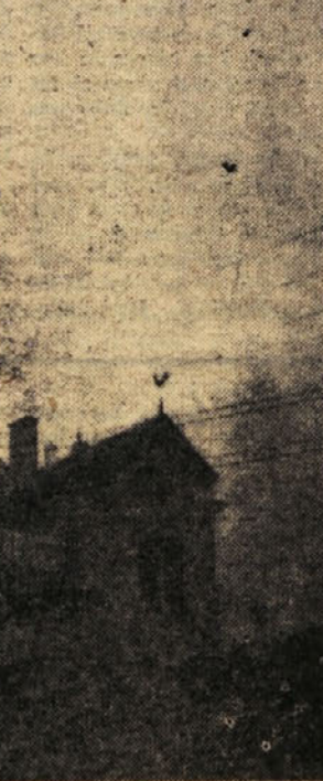
● NEKAJ MANJ KOT STO LET krasi Spodnji Hrastnik »zasavski Miramare«. Grad bi lahko v prihodnje postal hrastniška turistična atrakcija