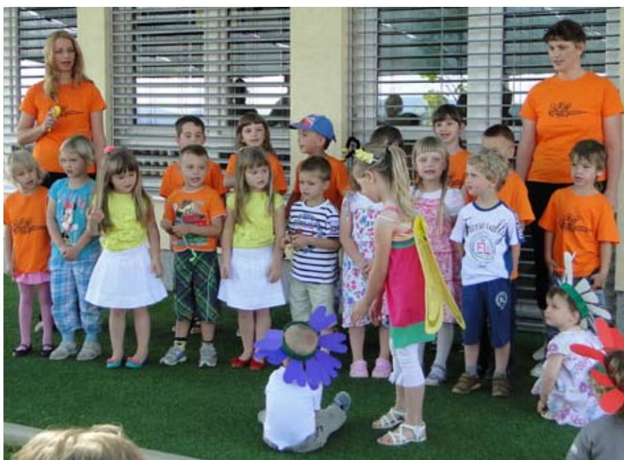
Zaključek šolskega leta v vrtcu