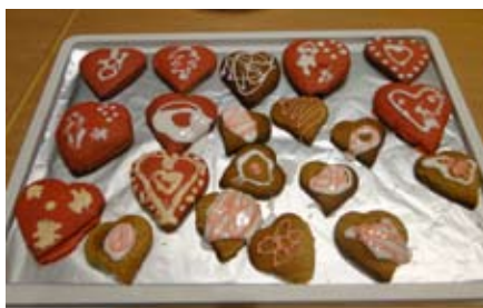
Medena lectova srca

Tudi dvoje srečanj s starši sta bili malo medeni. Na praznični decembrski delavnici so otroci s starši s sladkorno maso okraševali medena lectova srca, ki so se v vrtcu spekla že dan prej.