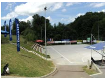
Pogled na igrišče