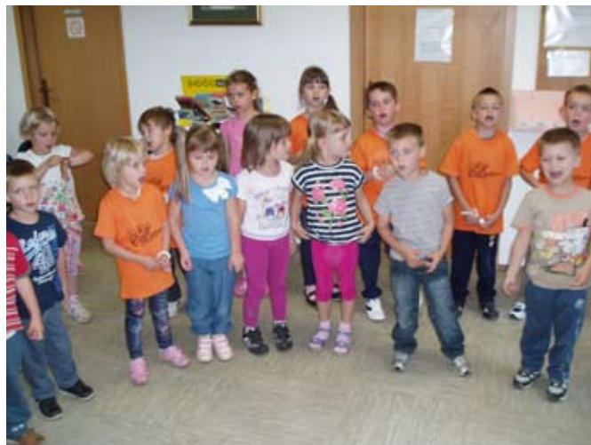
Minimaturanti in otroci iz skupine Zmajčki