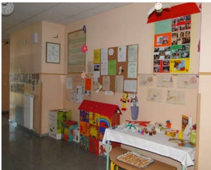
Izdelki in risbice otrok

Šolsko leto se je iztekalo in v mesecu juniju smo se tudi v vrtcu