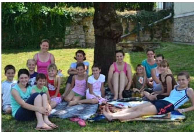
Počitek v senci