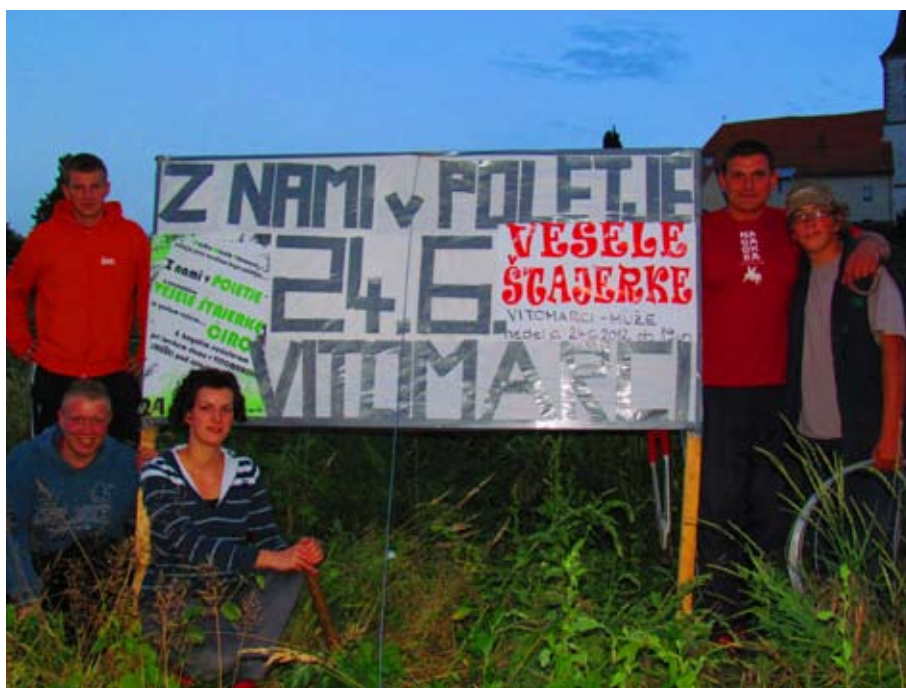
Postavljanje oglasne table

Zaradi prevelikih stroškov in posledično negativnega finančnega dohodka, bomo primorani take vrste prireditve zmanjšati ali celo ukiniti, saj sami tega več ne bomo zmogli financirati. Časi se spreminjajo, velika svetovna gospodarska kriza dela svoje in prav tako ni več dovolj pomoči donatorjev ali sponzorjev. Mladi v naši občini se bomo sicer še naprej trudili, da bo naš kraj in naše društvo še naprej vsaj tako znano v naši dr-