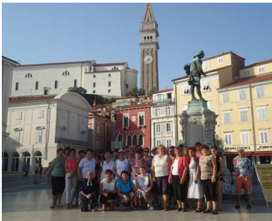
Gospodinje na Tartinijevem trgu

V soboto, 30. 6. 2012, smo se ob 6. uri zjutraj odpeljale na enodnevni izlet proti morju, mimo Celja in Ljubljane v Koper. S pomola v Kopru smo se z ladjico odpeljale na dvourno ekskurzijo, na ogled slovenske obale, in sicer od reke Dragonje do Debelega Rtiča. Ko smo se vrnile, je sledil ogled Luke Koper, danes sodobnega evropskega pristanišča, ki je že davno preraslo koprsko mestno jedro. Z avtobusom smo se zapeljale med kontejnerji, terminali in skladišči ter ob razlagi spoznale veličino našega edinega pristanišča. Po ogledu smo si privoščile kosilo. Nato smo se odpeljale v Izolo, v Simonovem zalivu smo nekatere uživale v kopianju v slovenskem morju, druge smo se sprehodile po mestu, tretje pa odšle na hladno pijačo, kavico ali sladoleđ. Sledil je ogled prijetno urejenega mesteca Piran, ki