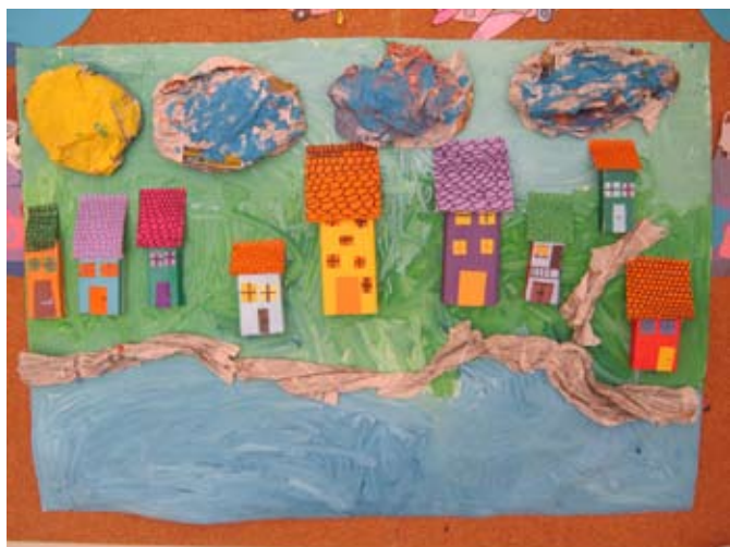
Potovanje v mavrično deželo