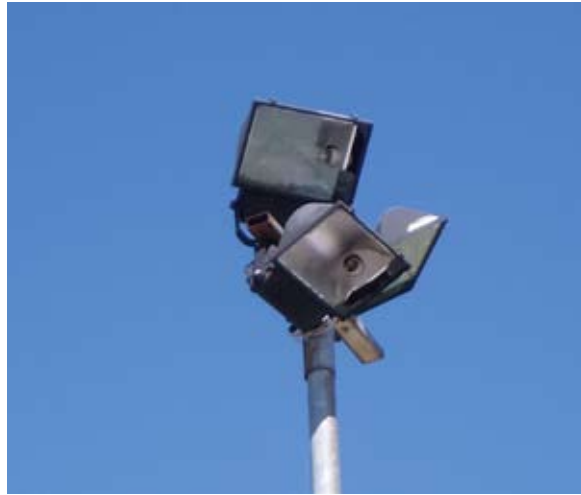
Razbiti reflektorji na šolskem igrišču