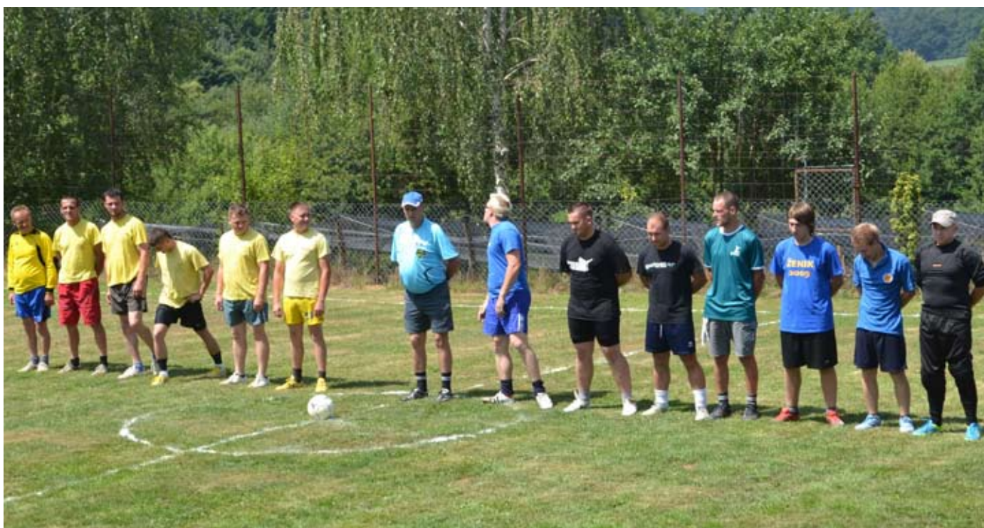
Ekipe v pripravljenosti