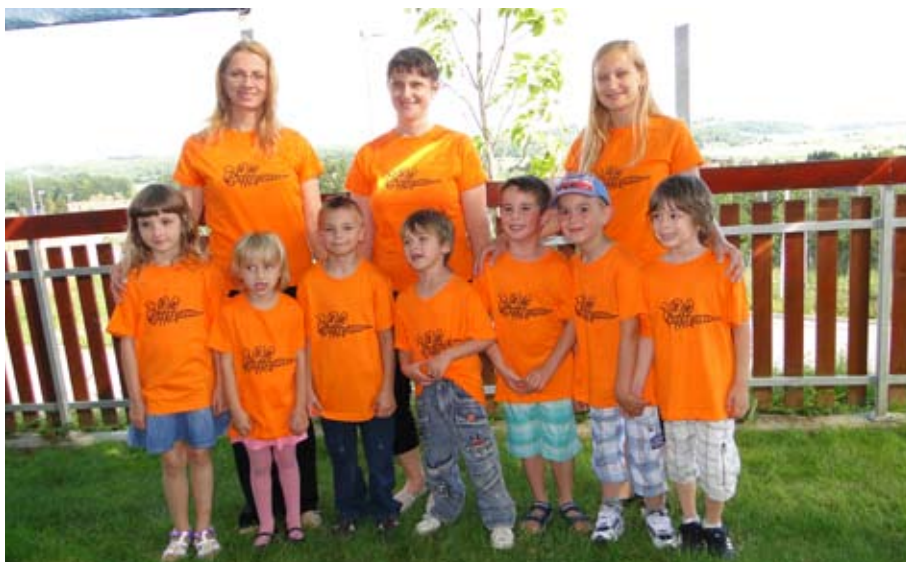
Minimaturanti s svojimi vzgojiteljicami