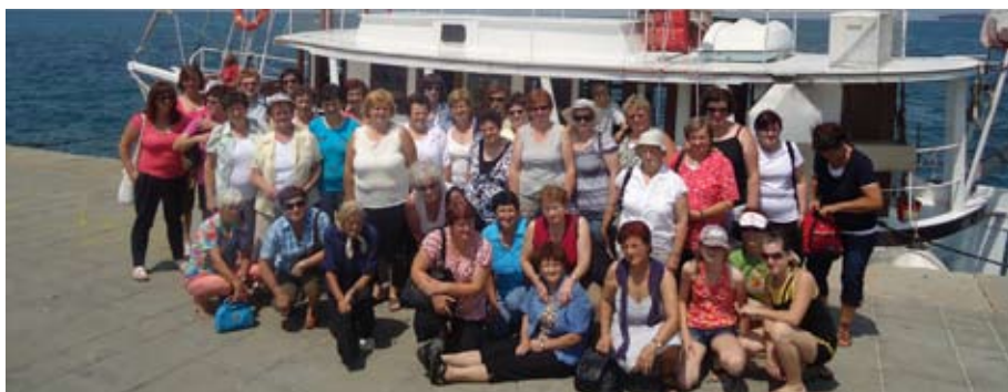
Z ladjico na ogled slovenske obale

je najlepše mesto na slovenski obali. Ima veliko prijetnih trgov in ozkih ulic. Najlepši je Tartinijev trg z mnogimi čudovitimi zgradbami okrog pianistovega spomenika. Po želji smo si lahko ogledale druge zanimive predele Pirana. Ob dogovorjeni uri smo se odpeljale proti domu, kamor smo prispele v poznih nočnih urah.