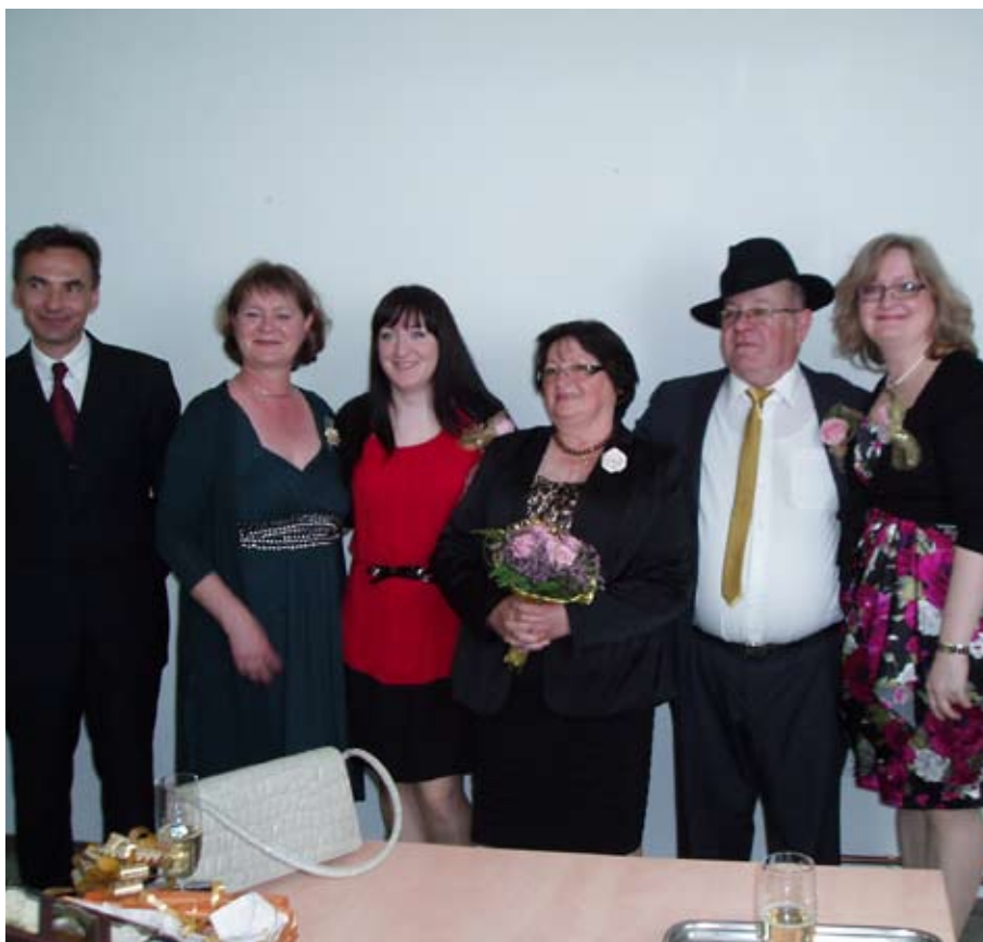
Zlatoporočenca s svojimi najbližjimi