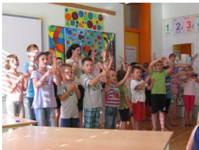
Otroci na zaključni predstavitvi