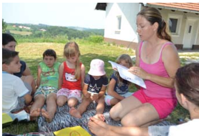
Med branjem zgodbe