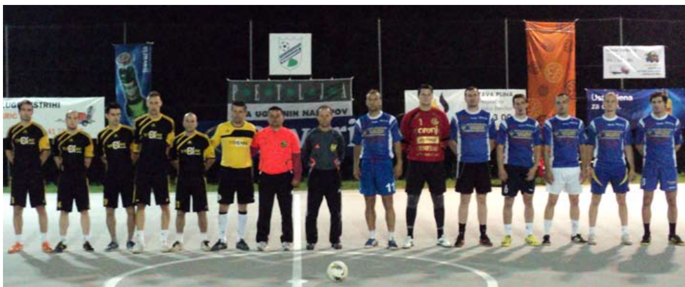
Finalista Extrem in Hana