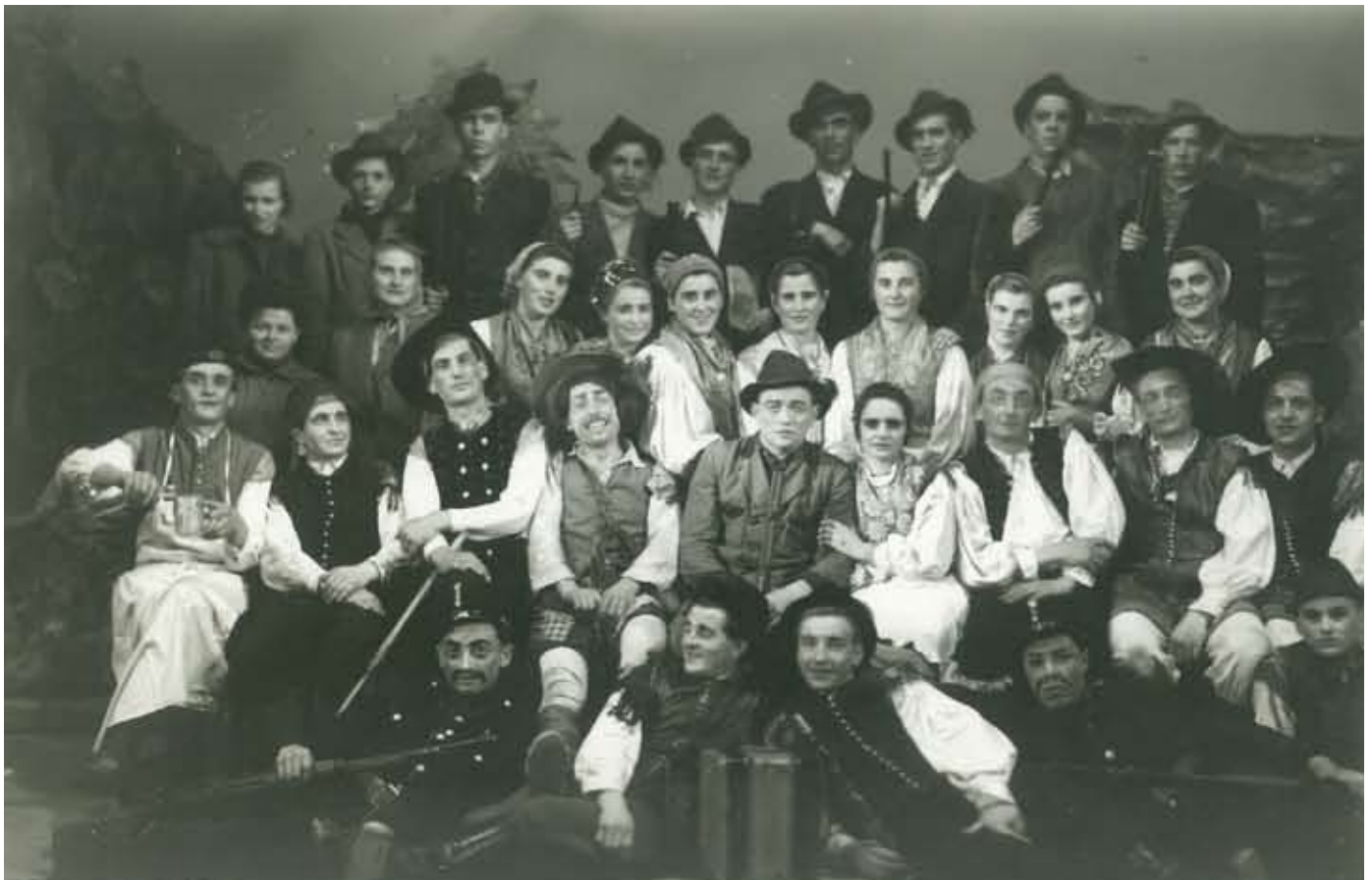
Igra: DIVJI LOVEC, sezona 1956 / 1957, režija: Boris Toš

biteljske kulture v domači občini. Takrat smo zapisali, da bomo delo na področju ljubiteljske kulture za vsakega izmed njih predstavili