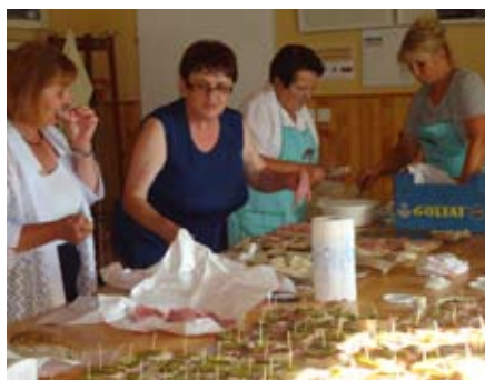
Gospodinje pripravljajo pogostitev

V petek, 22. junija 2012, ob dnevu državnosti pri lipi pred cerkvijo so Ljudske pevke društva gospodinj za-pele na proslavi. Gospodinje pa so poskrbele za pogostitev. Spekle smo kruh, kvasenice, krapce, potice in pecivo več vrst ter vse to prinesle v kuhinjo društva upokoencev. Naredile smo obložene kruhke in skupaj z ostalimi dobrotami pogostile vse prisotne.