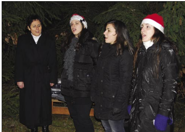
Büdingske dekle so popejvale božične pesmi

ka si je poglednemo, se slišijo svete pesmi, pa nej samo s cd-na, liki v živo tō. Za tau se pa leko zahvalimo pevskomi zborčki KUD Budinci, šteri zdaj že tretjo leto nastopa pri nas, gda mamō žive jaslice. Leko povejm, ka brezi njij bi te večer naj biu taši, kak je biu zdaj, dapa tau samo tisti