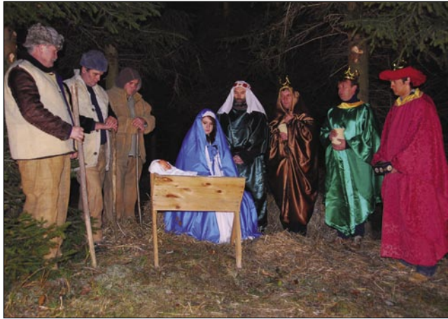
Andovski živi betlehem

Porabsko kulturno in turistično društvo Andovci pa Manjšinska samouprava Andovci zdaj že štrto leto organizirata žive jaslice (élő betlehem) v Andovci. Zdaj že vejn več kak dvajsti lejt