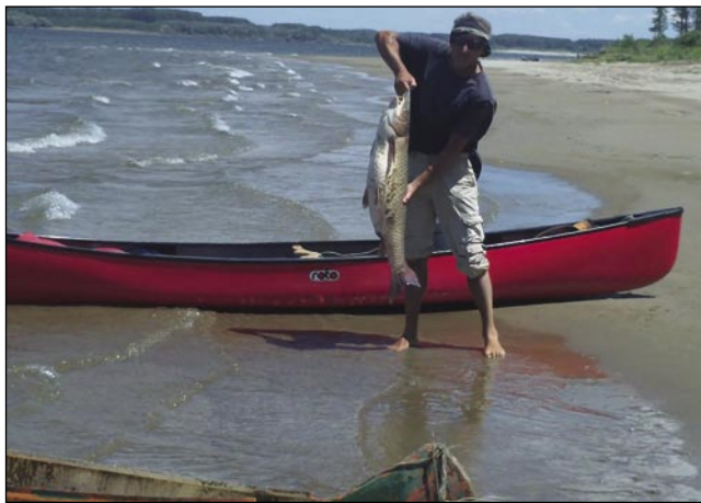
Na obali Dune

turističen, domače prekmuske firme Roto. V takšom čuni moreš klečati, ge sem pa sejdo, tak kak tau delajo ovak v kajaki. Samo kanu ma samo eno veslo, zatau sam se odlaučo za té čun. Nejssem želo biti hiter, nejssem meu sile, ges sem šču v meri pogledniti vse, ka se je godilo na vodej pa v okolici rek.«