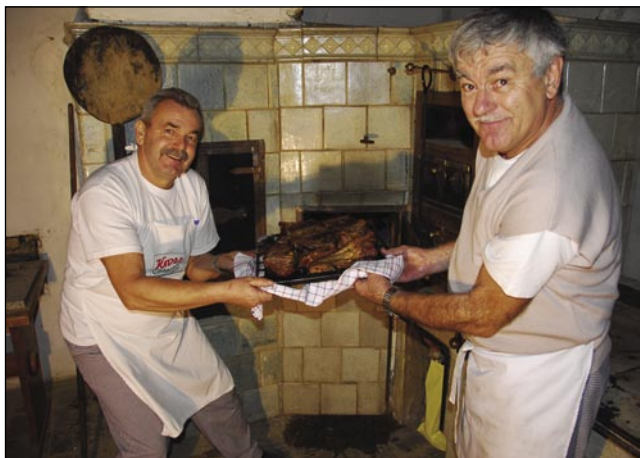
Kūjara pri indašnjoj peči v stari domačiji

Potejm smo v toplo dvorano šli, gde sta nas že küjara z žmano večerjov čakala. Leko povejm, ka tašo dobro pečeno mesau sem eške nikdar nej djo kak te, v tejm je njima vejn eške Baug malo tō vcujpomago. Eške prvin kak bi se nadjeli, sta dva Djaužina začnila špilati na svoje inštrumente pa napravla dobro razpoloženje (hangu-lat). Njima se posaba moram zahvaliti, zato ka sta zdaj že