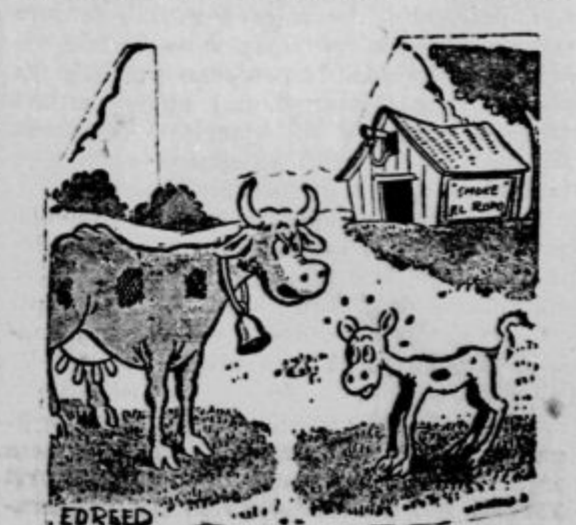
»Zapomni si za vselej, kadar pozovim: z zvoncec h kosilu, moraš biti točen!« (Everybody's weekly)