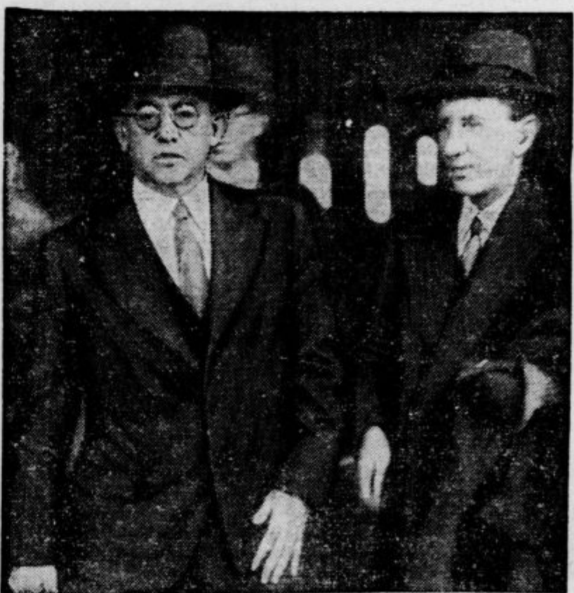
Je dospel v Evropo in išče stikov z nemško vlado. O njem pišejo, da je naklonjen zahtevam Nemčije, da bi se ji vrnilo bivše kolonije v Afriki — toda z izključitvijo bivše Nemške jugozapadne Afrike, nad katero ima Južna Afrika mandat. Praktično pomeni to, da bi Južni Afriki ne bilo proti volji, če bi — Francija vrnila svoje kolonije v Afriki, ki so bile nekoč nemška last. In to je menda splošno angleško stališče