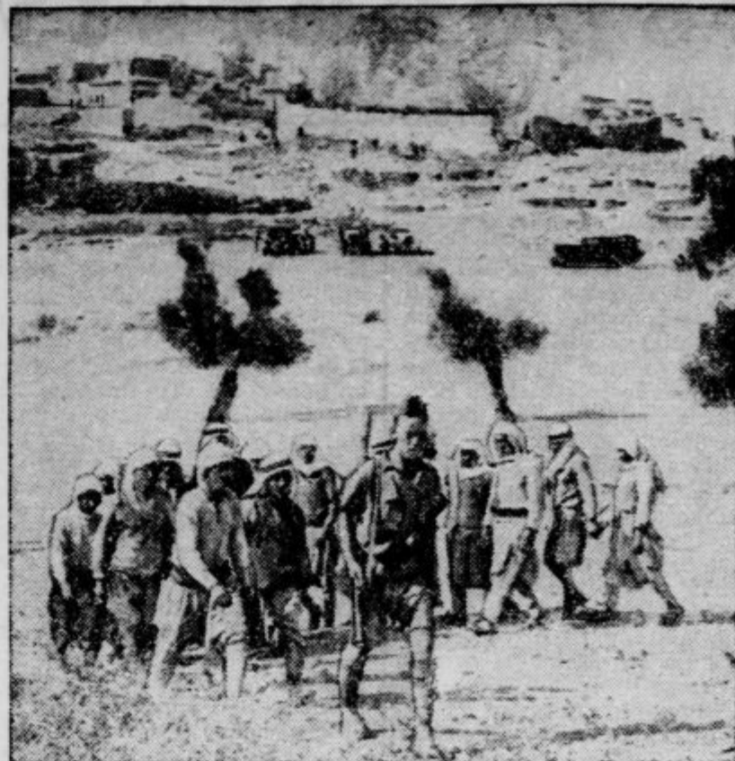
Aretrane arabske upornike vodi angleški vojak v koncentracijsko taborišče