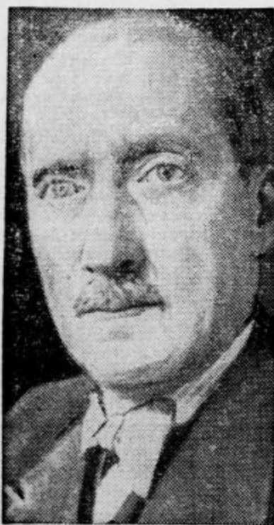
Dosedanji francoski finančni minister Marchandeu