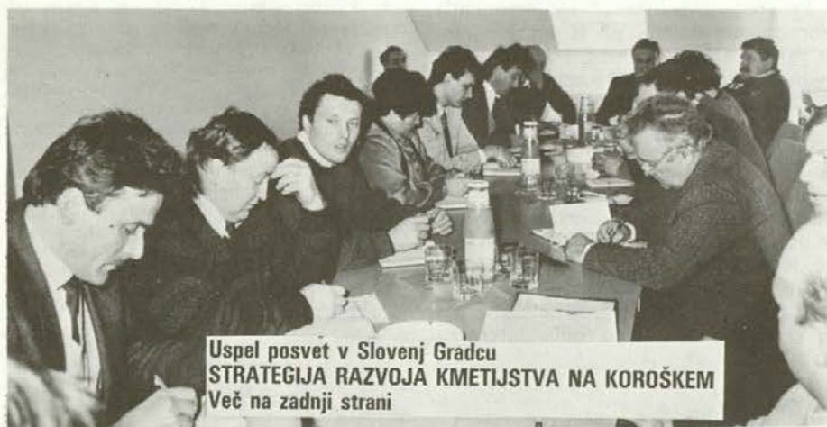
Uspel posvet v Slovenj Gradcu STRATEGIJA RAZVOJA KMETIJSTVA NA KOROŠKEM Več na zadnji strani