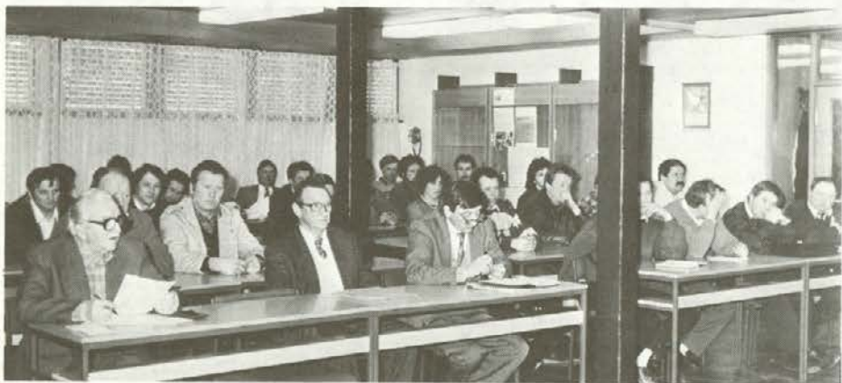
Letna konferenca Slovenske kmečke zveze-Ljudske stranke v Slovenj Gradcu