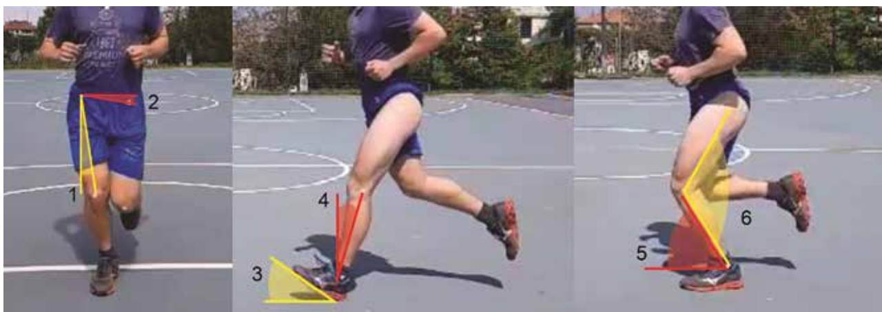
Slika 2: Primer 2D video analize teka za najpogostejše parametre: primik kolka/stegnenice (1), kontralateralni spust medenice (2), kot stopala glede na podlago (3) ter naklon golenice (4) ob prvem dotiku podlage ter upogib gležnja (5) in kolena (6) v sredini faze opore (Slika je izdelek avtorjev)

S pomočjo 2D video analize lahko vrednotimo tehniko teka v kontekstu preventive pred poškodbami. Avtorji raziskav pogosto omenjajo večje obsege gibanja v čelni ravnini kot dejavnik tveganja za razvoj kroničnih poškodb. Mousavi in sodelavci (2019) so v preglednem članku ugotavljali povezavo med kinematičnimi parametri teka in tendinopatijami spodnjih okončin pri tekačih. Ugotovili so, da je izrazita everzija stopala močen dejavnik tveganja za razvoj sindroma iliotibialnega trakta, patelarne tendinopatije in disfunkcije tetive m. tibialis posterior. Pokazali so tudi, da obstajajo zgolj omejeni dokazi, ki povezujejo večji upogib kolena v zgodnji fazi opore in notranjo rotacijo stegnenice z razvojem tendinopatij spodnjih okončin. Barton idr. (2009) so naredili sistematični pregled literature, v katerem so raziskovali lastnosti tehnike teka pri