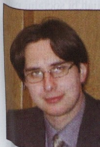
Piše: Jure Snoj, univ. dipl. ekon.

Proračunski primanjkljaj je februarja znašal kar 21 milijard tolarjev, do konca marca je zrasel na 28,4 milijarde, do konca leta naj bi znašal 41 do 60 milijard. To je veliko več, kot znaša proračunski fiskalni stabilizator, saj dovoljuje le 15 milijard tolarjev dodatnega primanjkljaja.