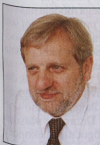
Piše: Gregor Miklič, izvršni sekretar ZSSS

Novi zakon o delovnih razmerjih v 129. členu določa, da delavcu pripada dodatek za delovno dobo, višina tega dodat-