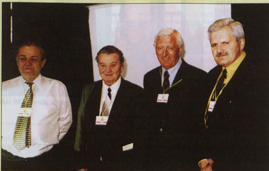
Sestava nedavne skupščine Sindikata komunale, varovanja in poslovanja z nepremičninami Slovenije je bila dokaj pisana. Eden od kandidatov za predsednika je kljub temu menil, da imajo starejši v sindikatu prevelik vpliv. Čeprav z njim za govornico niso polemizirali, so se štirje zdaj že bivši predsedniki tega sindikata postavili pred našo kamero. Hoteli so povedati, da mora biti v vsakem sindikatu prostor za vse starostne kategorije – tudi za malo starejše.

»Ali ne bi bilo boljše, če bi šel na popravilo ti?«