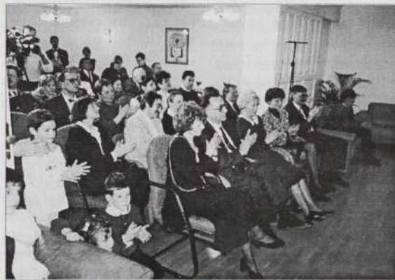
Člani društva na slovenskom veleposlaništvu ob slovenskem kulturnem prazniku

Na začetki leta smo svetili den slovenske kulture na veleposlaništvu (nagykövetség) Republike Slovenije. Te den smo vküp svetili z veleposlaništvom, z Državno slovensko samoupravo, z Zvezo