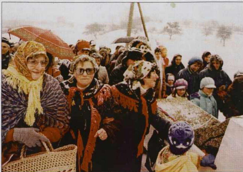
Borovo gostüvanje v Andovci leta 1994.

Žmetno živemo gnesnaden, vse je drago. Depa donk, zato vsikši dobi nikše penaze (plačo, penzijo, socialno podporo). Pred 1960. lejтами nej tak bilau. Vsikši je paver biu pri nas. Če so mladi odišli krü slüžit - na repo, na kukarco - so tó bole žito, pšenico, kukarco domau prinesli kak penaze. Paversko delo je naše lüstvo tadržalo . Dosta so mogli lidgé delati, pa pauv nej vsikder lejpi büu. Megla, toča, süuča, črvi, vrane... vse tau je leko pauv na nikoj djalo. Lidgé so se prauti torna branili s šatriranjem. Na fašensko nedelo so lejpe, kraugle krofline pekli. Na fašenski torek so sejali mak - naj nede črvivi, lüškili kukarco za semen - naj vrane ne bi vösklükale. Od zranka do večera so ojdli po vesi fašencke . Moški, najbole pa mladi, neoženjeni podje so se nutnaravnali. Pri vsikšoj izi so je fejst čakali, ka so brodili, ka do - srečo, zdravdje, lejpi pauv meli tisto leto. Moški so ovak tó srečo priner... k izi (ženska