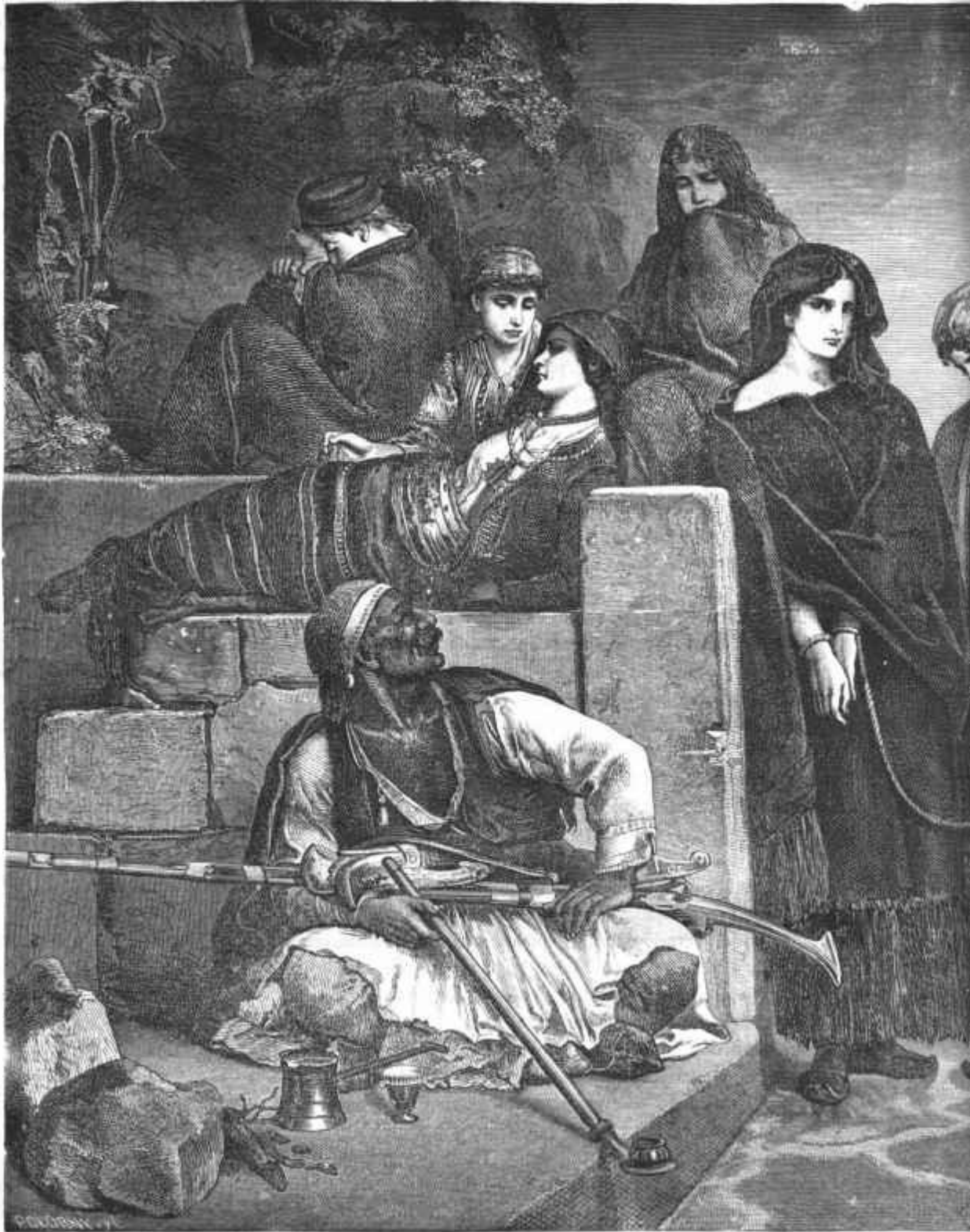
Bažibozuki vedó herce