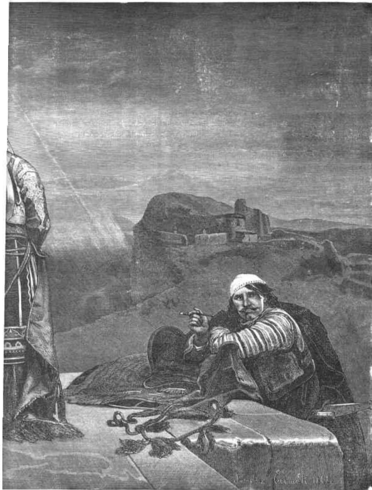
eklice na pródajo.

Žalost in toga zbog nesreče národove je grizla pošteno dušo Preradovićevo, a bolezen je trla telo njegovo