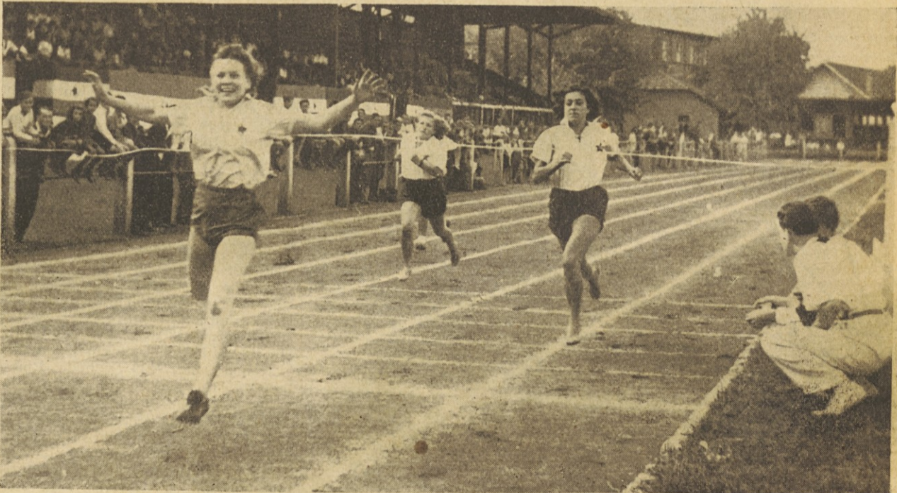
Zlet v Zagrebu - Finalni tek tovarišic na 60 m

Končni izid tekmovanja posameznih moštev je bil: 1. III. Armija 97 točk, 2. KNOJ 67 točk, 3. Mornarica 57 točk, 4. IV. Armija 33 točk, 5. V. Armija 16 točk, 6. Letalstvo 4 točke in 7. I. Armija 2 točki.