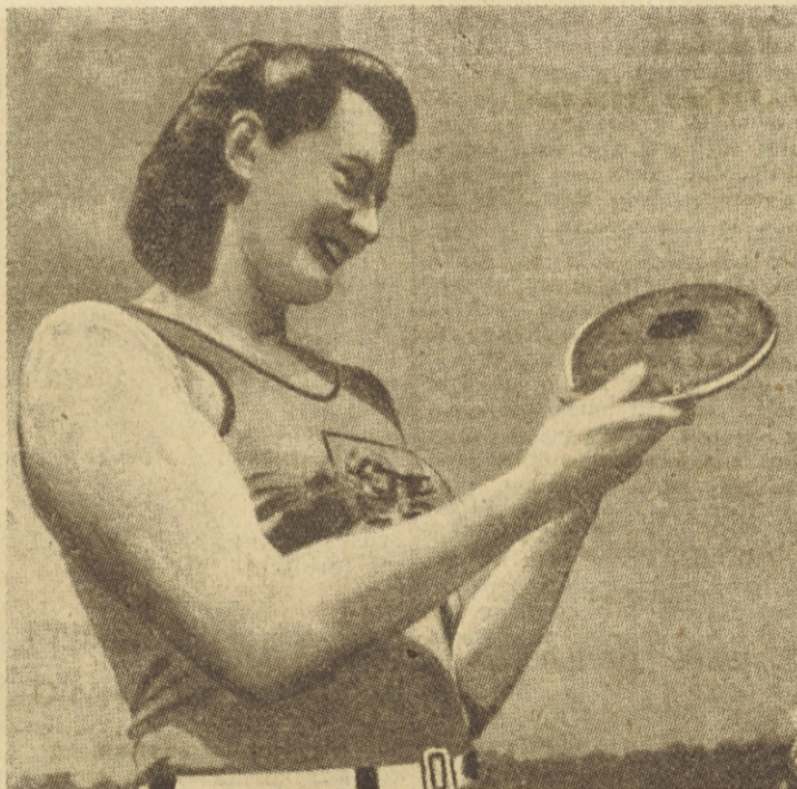
NINA DUMBADZE, svetovna rekorderka v metu diska - 49,88 m

mostojno Slovensko planinsko društvo po onih edinicah, ki jih s tem poveri glavni odbor ali skupščina SPD. Pravila in pravilniki SPD se prilagodijo tem načelom.