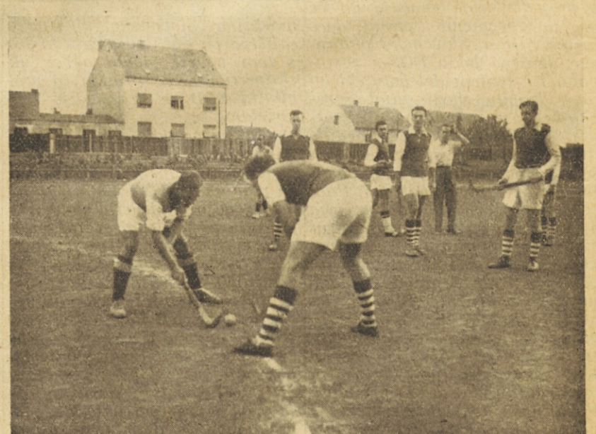
Zlet v Zagrebu - Hockey na travi