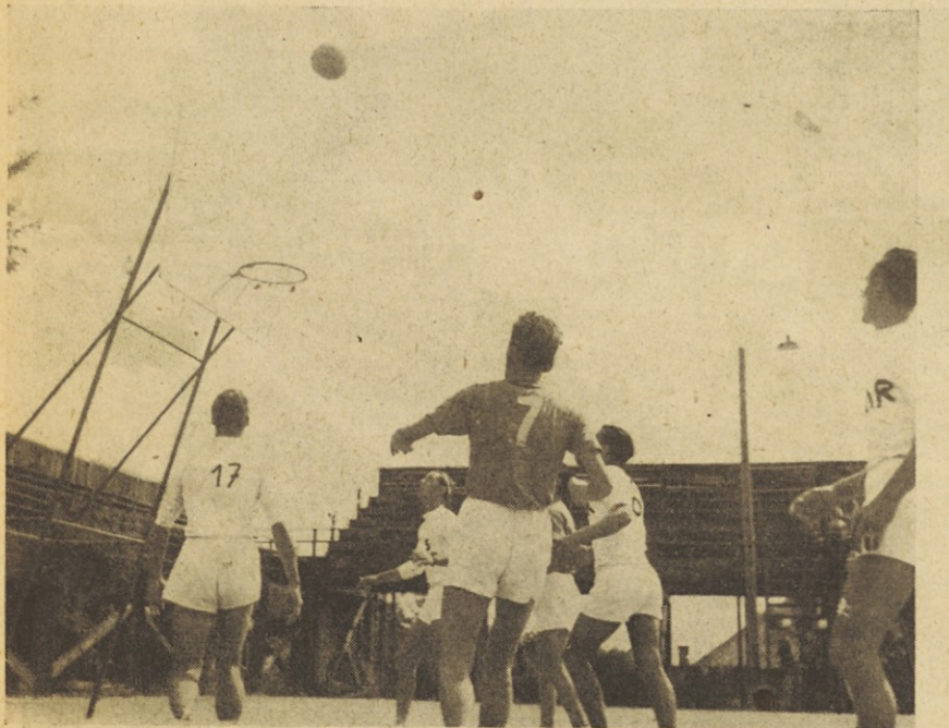
Zlet v Zagrebu - Košarka

(Dalje prih.) Glavni odbor SPD se bo sestal v soboto 22. septembra 1945 ob 19.30 uri v prostorih Zveze Fizikulturnih društev Slovenije v Narodnem domu v Ljubljani. Dnevni red: 1. Položaj SPD in odnos do Zveze fizikulturnih društev Slovenije. 2. Določitev smernic za nadaljnje delo SPD in po. družnic. 3. Osnutek pravil. 4. Raznoterosti.