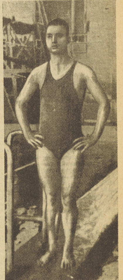
LEONID MEŠKOV, svetovni rekorder v prsnem plavanju na 100 m v času 1:06,2 minute