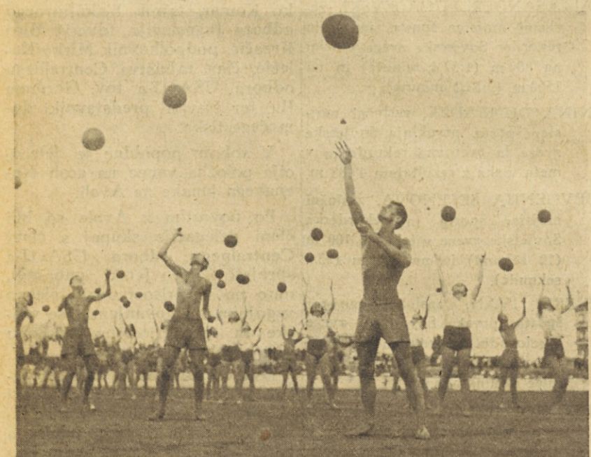
Zlet v Zagrebu - Slušatelji šole za telesno vzgojo pri vajah z žogo