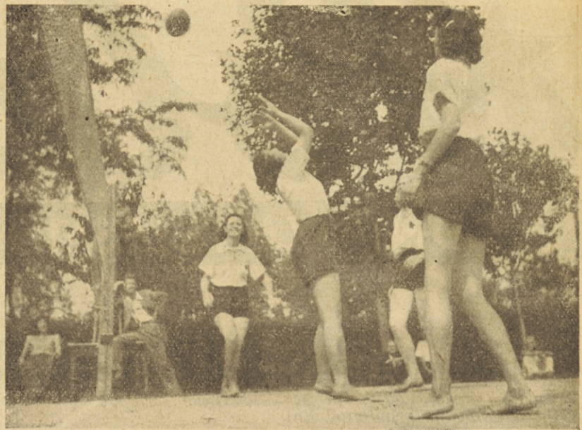
Zlet v Zagrebu - Mladinke pri odbojki

Ob zaključku zleta je predsednik Fizikulturnega odbora Makedonije pozval vse pripadnike telesne vzgoje, naj nadaljujejo s svojim delom, ki so ga začeli na Ilindan in naj se prihodnje leto zopet sestanejo, močnejši in bolj pripravljeni kot so bili letos.