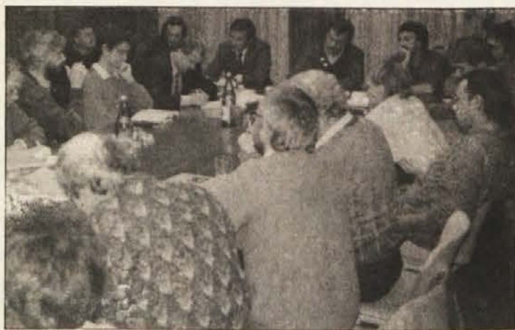
Nadstrankarski komite za obrambo dvojezične šole na Koroškem je takoj po dunajskem sklepu zasedal in sprejel protestno izjavo ter sklepe o nadaljnjem ukrepanju.

V čem torej Sinowatz in njegovi somišljeniki iz ÖVP in FP vidijo s strani Sinowatza zatrjevano „izboljšanje kvalitete pouka“? Če samo dejstvo, da so na strankarskem vrhu sklenili ločitveni model, izničuje vse ostale, v Strokovni komisiji dodelane in predlagane pozitivne spremeljajoče ukrepe. S tem sklepom hočejo uničiti in zavreči tudi vsa spoznanja, ki smo si jih koroški Slovenci, z nami pa znanstveniki z univerze, Rektorska konferenca in demokratične sile v Avstriji pridobili v dolgoletnih pogajanjih in pripravah. Sklep strankarskega vrha odteguje pogoje slovenski narodnosti za obstoj, hkrati pa nagradjuje nemškonacionalce z darilom v milijonski vrednosti, in to prav v času, ko sicer govorijo o varčevalni politiki.