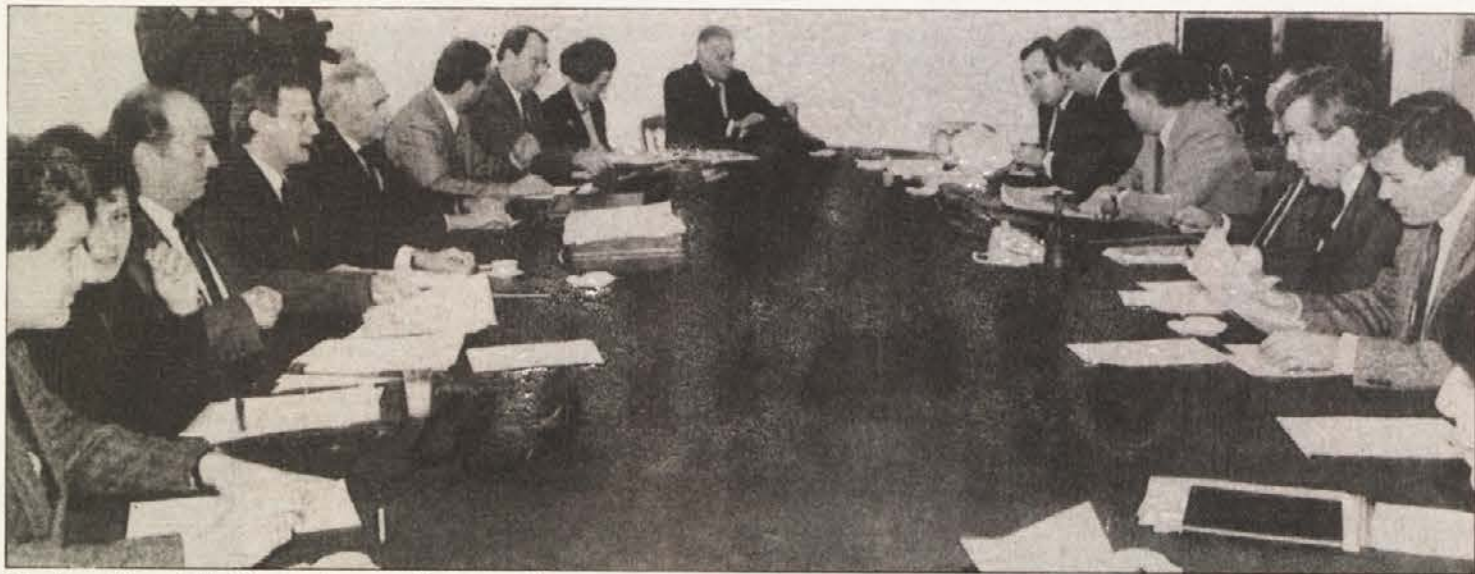
Zastopniki avstrijskih strank so se že po krajšem pogovoru zmenili za ločitveni model.

Pričakujemo pa tudi podporo s strani vseh podpisnic državne pogodbe, ki so nam takrat zajamčile pravice v 7. členu tega mednarodno veljavnega dokumenta.