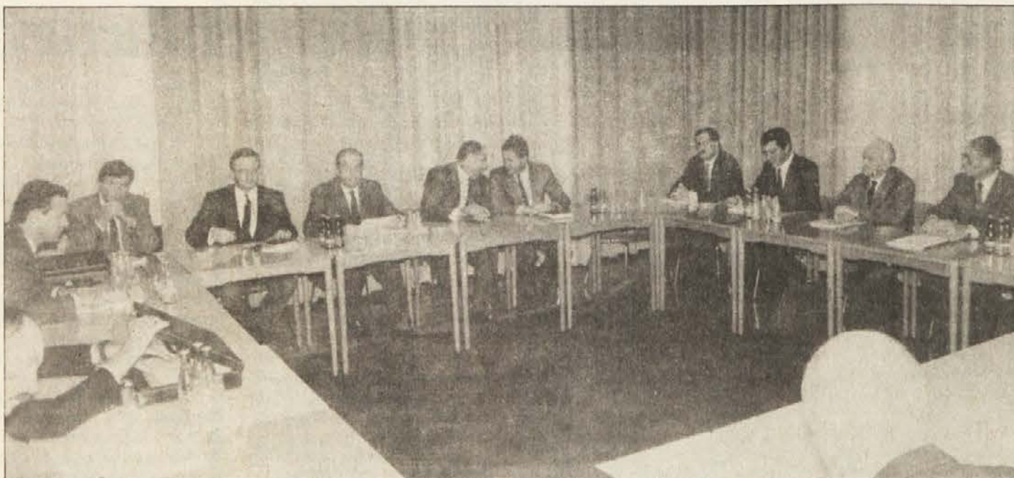
Schon beim Gipfelgespräch der Vertreter der drei im Kärntner Landtag vertretenen Parteien mit den Vertretern der Kärntner Slowenen kündigte sich die kompromißlose Haltung der Kärntner Parteien an.

Wir betonen noch einmal, daß wir für weitere Gespräche vor allem mit den zuständigen Bundesbehörden mit dem Ziel bereit sind, die Existenz und Entwicklung unserer Volksgruppe zu sichern und so unseren Teil zum Frieden im Lande und im Staate beizutragen.