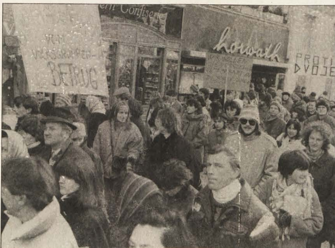
Am 31. Jänner dieses Jahres haben tausende Slowenen in der Bundeshauptstadt gegen die beabsichtigte Trennungspolitik in einer Großdemonstration demonstriert!

Die beiden Zentralorganisationen der Kärntner Slowenen werden in den nächsten Tagen auf Vertrauensleutekonferenzen die Frage der prinzipiellen Volksgruppenpolitik abklären und die weiteren Schritte in der Schulfrage festlegen.