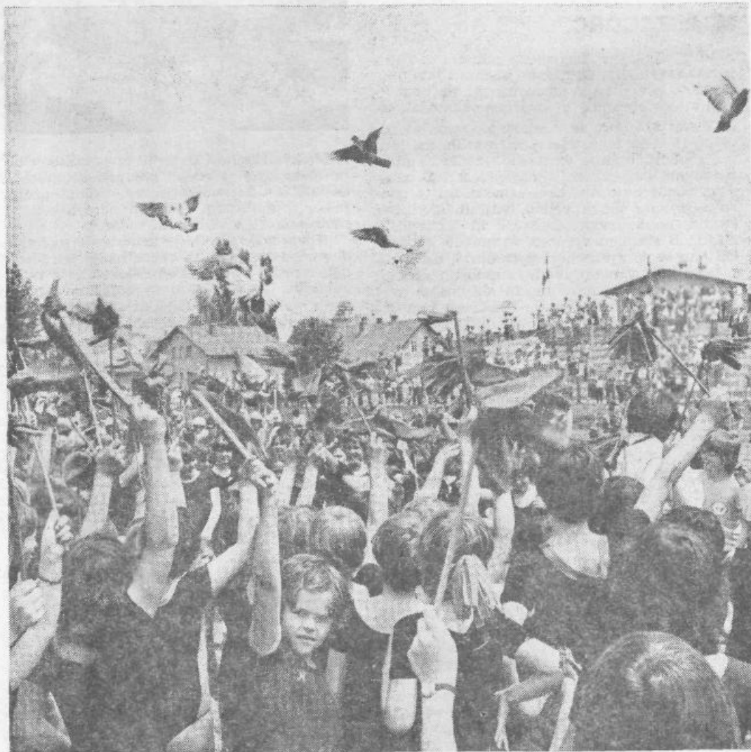
Slovesen zaključek prireditve