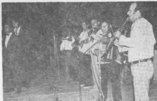
Dobro obiskani kulturni večeri

• V novem tednu na praznovanje spominja slavnostna tribuna (prenešena s stadiona Ilirije) pred občinsko stavbo in kulturni večeri od ponedeljka do četrтка. Nastopale so šišenske kulturne skupine v veliko zadovoljstvo številnih Šiškarjev. Obisk je presegel vsa pričakovanja. Jasno se je pokazalo, da bi taki večeri in take kulturne prireditve v Šiški vedno našle dober odmev.