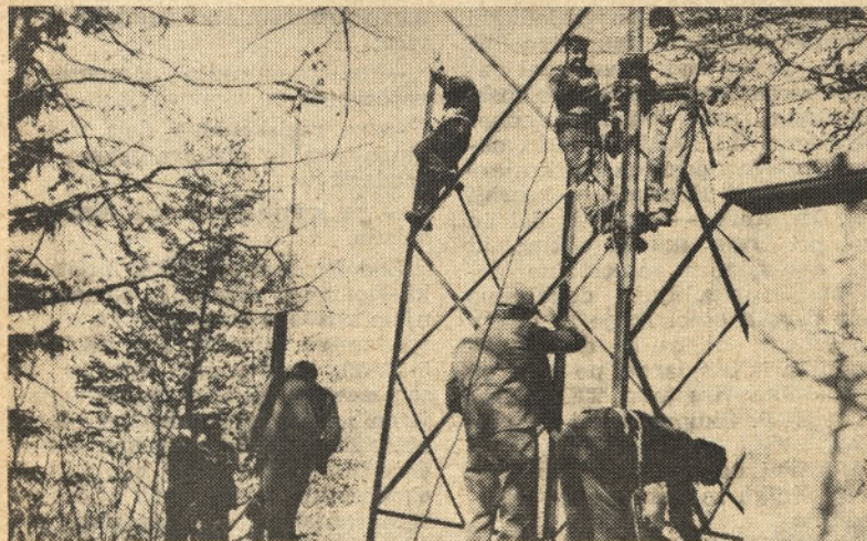
Prvih 8 metrov od 31 kolikor je stolp visok je montiranih