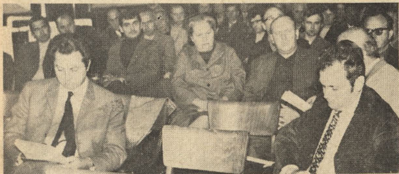
Člani ZK Steklarne med razgovorom o nalogah, katere nam nakazuje pismo tovariša Tita