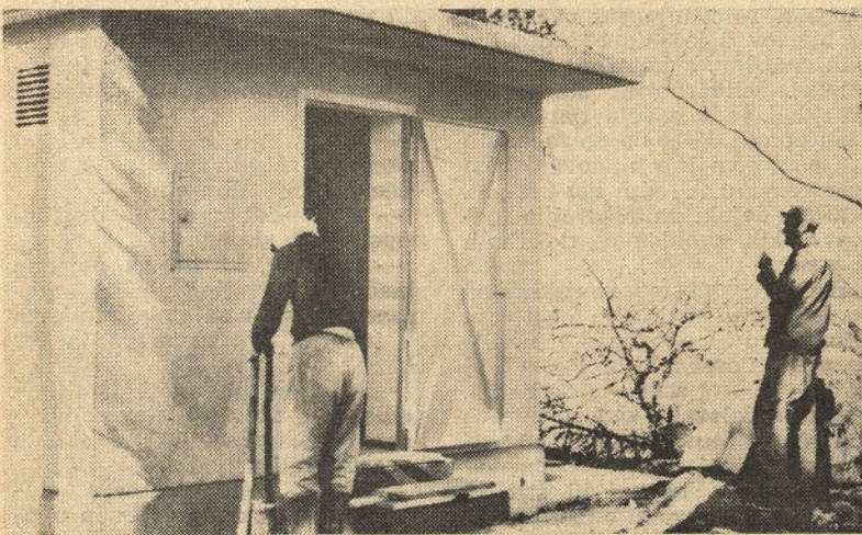
KOP je solidno izdelal pretvorniško hišico, ki bo nudila streho tudi za druge aparature lokalnih zvez