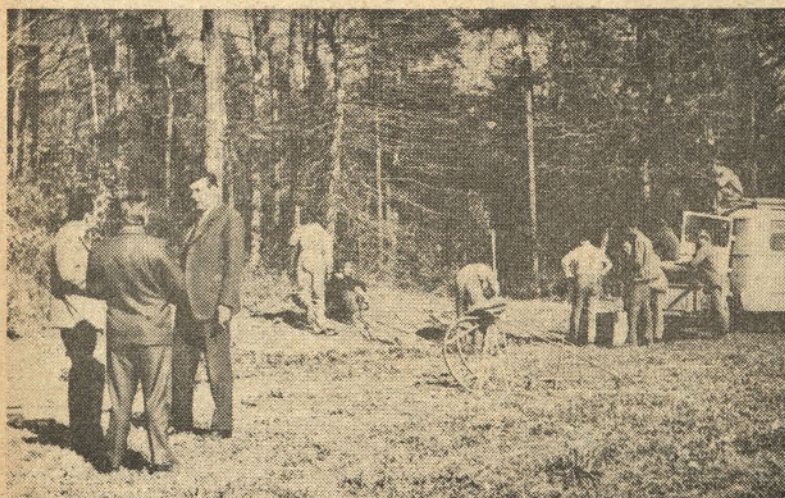
Dovod elektroenergije je bil težak problem — obisk predsednika skupščine s sodelavci na gradbišču