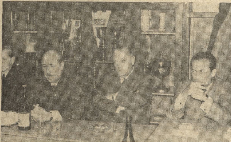
Predstavniki občine in družbeno-političnih organizacij na zasedanju DS

Želel mu je obilo zadovoljstva in zdravja v nadaljnjem življenju z željo, da še nadalje nudi vso pomoč pri delu v občini. Izročil mu je spominsko darilo v imenu vseh družbenopolitičnih organizacij občine.