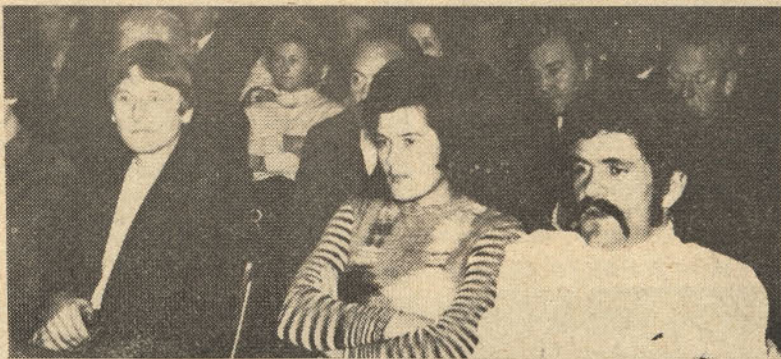
Člani ZK pozorno sledijo branju pisma predsednika ZKJ tov. Tita in izvršnega biroja predsedstva ZKJ

Članom in članicam kolektiva steklarne Hrastnik, kakor tudi vsem Hrastničanom čestitamo k Dnevu republike - 29. novembru