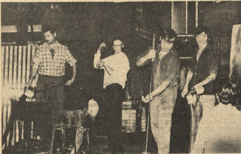
Brigada Volfand Viktorja pri izdelavi opalne razsvetljava