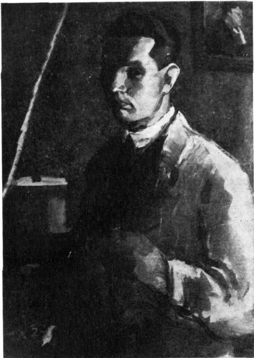
AVTOPORTRET, 1927, Loški muzej Sk. Loka, kat. št. 6

trospektivno razstavo. Andrej Pavlovec je o razstavi poročal v Gorenjskem glasu in objavil risbo Starka s knjigo (kat. št. 45). V Loških razgledih je izšel Pavlovčev članek, ki na koncu našteva literaturo. Objavlja naslednje oljne slike: Lastni portret s klobukom (kat. št. 59), V mlinu (kat. št. 52), Puštalski most (kat. št. 37), Tihožitje (kat. št. 70), Škofja Loka (kat. št. 58) in akvarel Kapucinski most (kat. št. 18). Razstavni katalog ni izšel.