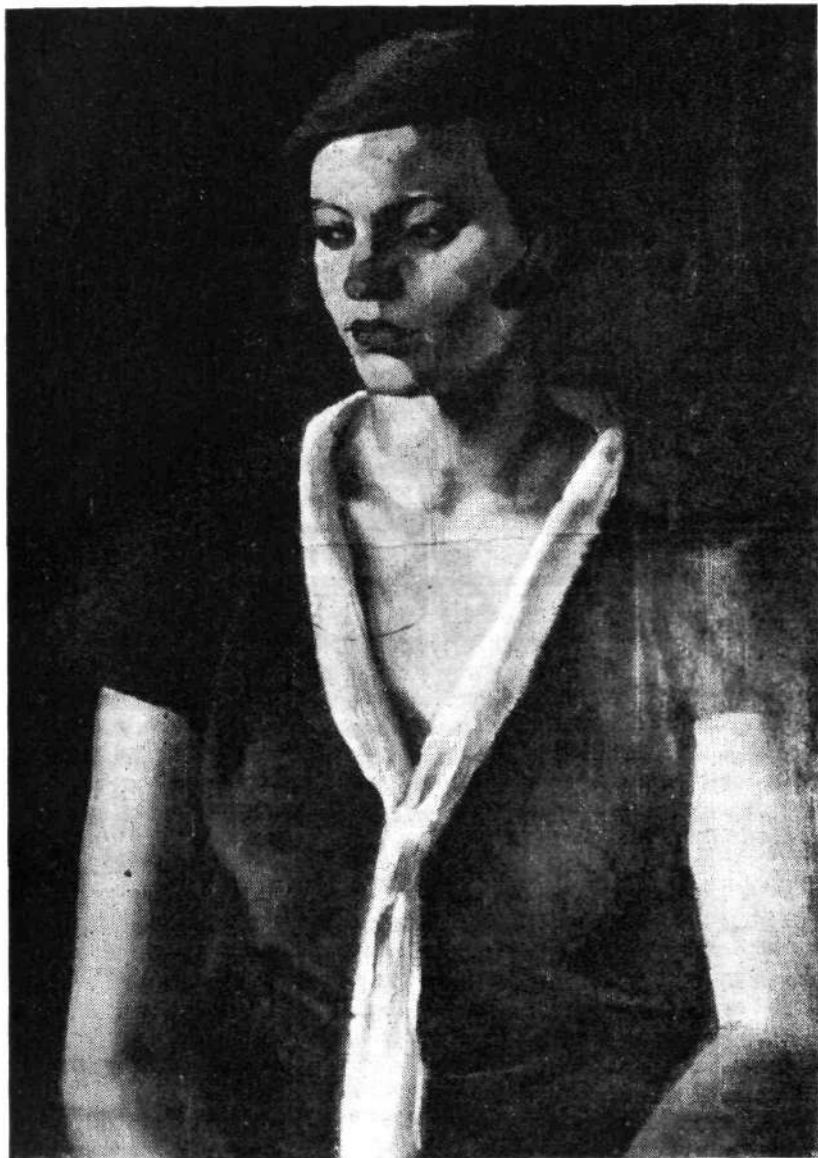
PORTRET DEKLETA, družina Košir Sk. Loka, kat. št. 61