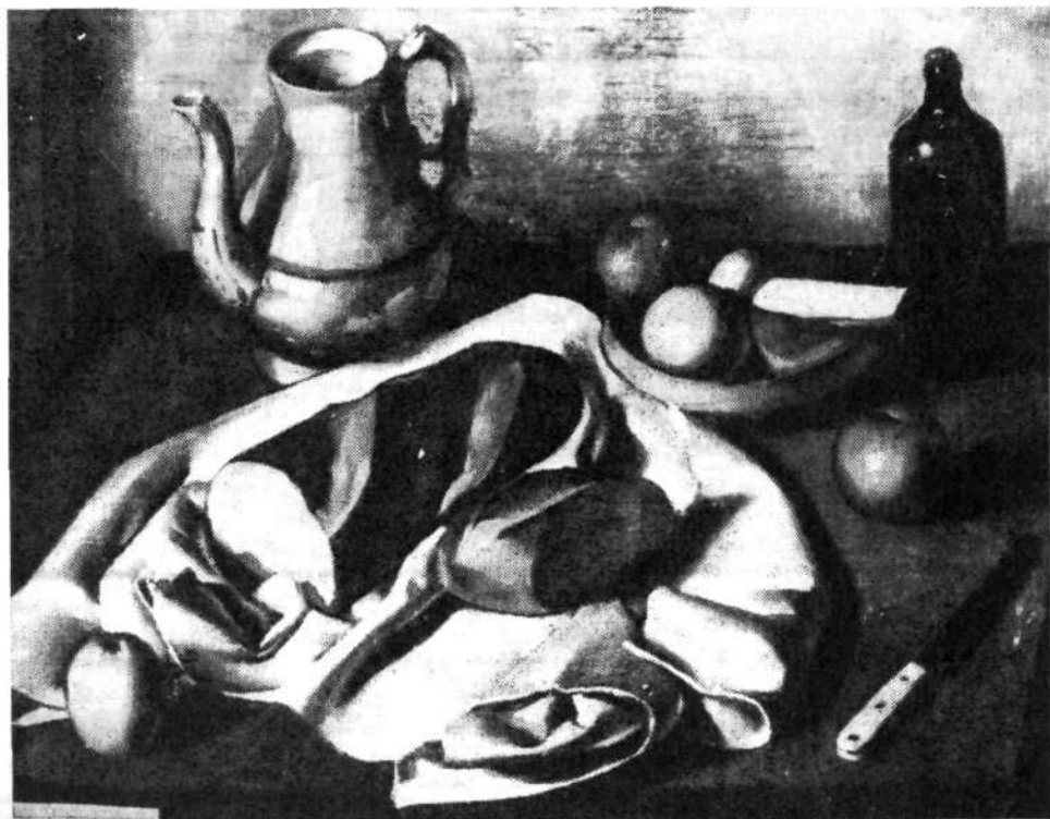
TIHOŽITJE, (1934), MG Ljubljana (Loški muzej), kat. št. 46