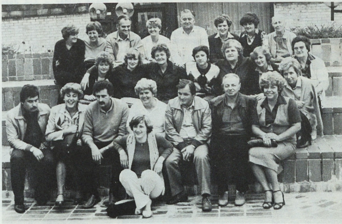
Delavci iz finančnega sektorja so v soboto, 20. 9. 1980 organizirali sindikalni izlet. Obiskali so rojstno hišo tovariša Tita v Kumrovcu, spomenik Matije Gubca in muzej v Stubicah ter muzej revolucije v Krapini. Škoda, da se poučnega in prijetnega izleta ni udeležilo več udeležencev, saj je bilo v avtobusu še natanko 17 praznih sedežev. Na sliki — udeleženci izleta pred spominskim domom v Kumrovcu.