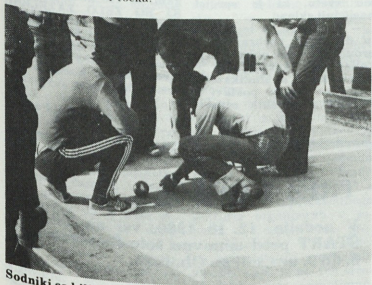
Sodniki so bili natančni.

Točkovali smo: 1. mesto — 15 točk, 2. mesto — 12 točk, 3. mesto — 9 točk, 4. mesto — 7 točk, 5. mesto — 6 točk, 6. mesto — 5 točk, 7. mesto — 4 točke, 8. mesto — 3 točke, 9. mesto — 2 točki, 10. mesto — 1 točka.