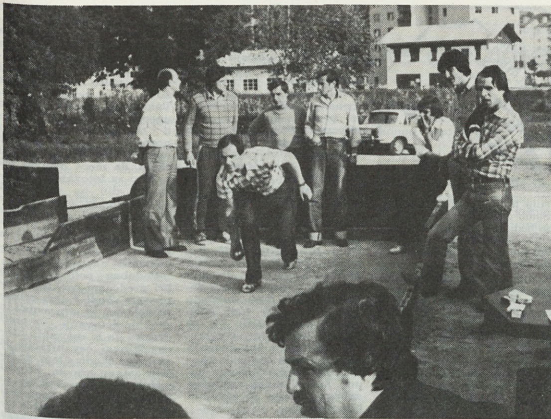
Balinišče pred ribiškim domom. Balinalo je kar 10 ekip, to je 30 udeležencev. Tekmovanje se je zavleklo do 22. ure.