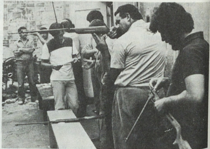
Tekmovanje v streljanju smo izvedli kar na tovarniškem dvorišču, pred gasilskim domom.