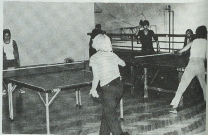
Pričetek tekmovanja v namiznem tenisu.