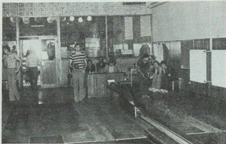
Kegljanja se je udeležilo 17 tekmovalcev – od tega tudi dve ženi.