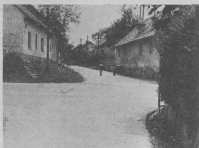
Tudi tale prometni znak „Stop“ v Zadvoru je zakrit, kar predstavlja nenehno nevarnost za voznike motornih vozil