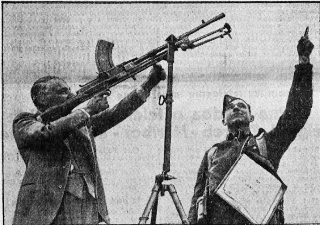
Angleški vojni minister Hore Belisha sam preskuša protiletalsko strojnico.

Ker so navedene evropske države posodile pokojnemu sultanu denar za državne potrebe, sedaj zahtevajo od dedičev poravnava starih dolgov. Dediči pa pravijo, da so vse države že obilno poplačane s svetom, ki jim je pri razkosanju zapadel v delež. Pravda traja že 14 let in končno besedo bo sedaj izreklo sodišče v Zürichu. Zadeva nikakor ni preprosta. Pri obravnavi bo treba do dna razglabljaliti vprašanja mednarodnega in naravnega prava, zgodovino vojske, ki je privedla do razpada cesarstva, zemljepis, geologijo, da se ugotovi vrednost ozemlja in zemeljskih plasti, kozmografijo, etnografijo, narodnostno pravo, če pripada zemeljsko bogatstvo narodu, ki je tam živel pod monarhijo ali članom monarhove družine itd. itd.