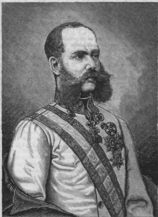
Cesar Fran Josip I.

Rudolf, grof Habsburški, je tedaj začetnik naše avstrijske cesarske rodovine, katera gospoduje v najlepšem in najmogočnejšem cesarstvu na zemlji.