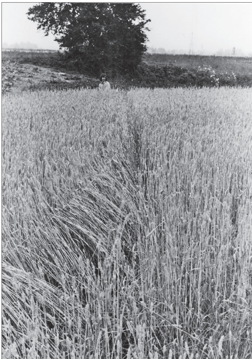
OHO, Milenko Matanovič, Žito in vrvica , 1969. Z dovoljenjem Moderne galerije, Ljubljana.

»rane« na platnu pa zopet povsem nedvoumno priključijo v spomin številne poznosrednjeveške nabožne upodobitve Kristusove rane na prsih (Bredenkamp, 2010: 261–264). To zaporedje premen v formi, ki izražajo eno in isto simboliko, temelječo na motivu zarez ali rane, umešča Matanovičevo delo v skupino vizualizacij simbolične forme, ki skozi stoletja in v različnih medijih priključuje nastanek vedno novih formulacij.