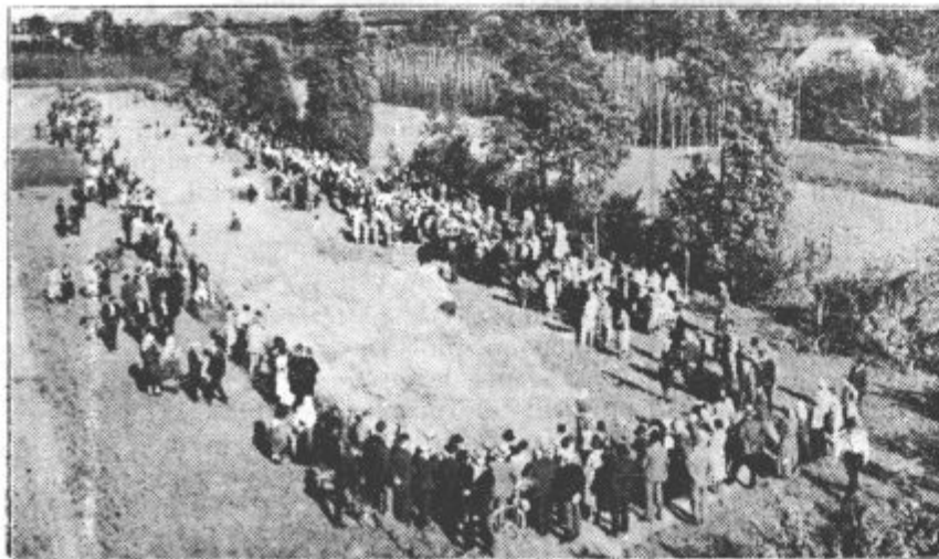
Velika tekma žanjic v Kapeli pri St. Jurju ob Taboru. — Slika nam predločuje nad 200 m dolgo njivo s pšenico na kateri tekmuje 15 žanjic v lepem kmetskem delu in kateri prisostvuje ogromna množica ljudstva.

S to prireditvijo je naše društvo pridobilo velik ugled po vsem Vranskem okraju, posebno pa še kmetsko mladino. Povsod, kjer še niso ustanovljena naša društva, se fantje in dekleta z veliko vnemo pripravljajo, da si ustanove lastna društva.