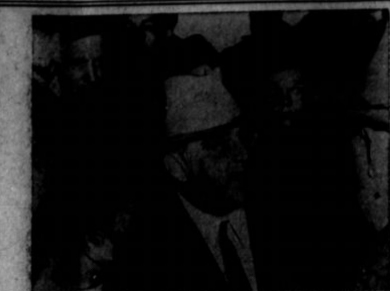
Ta slika Fiorella LaGuardia, glavnega ravnatelja UNRRA, je bila sneta v Berlinu, kjer je kritiziral politiko ameriških okupatorskih sil v zvezi z vprašanjem "brosdomcev" in odstavil angleškega generala Morgana, ki je bil glavni šef UNRRA v Nemčiji.

Da se je slovenska zavest v tem najzapadnejšem delu naše narodnostnega ozemlja budila in ohranjala kljub tako neugodnim razmeram, je v veliki meri tudi Trinkova zasluga. Fazizem, ki se je tako nestrpno zagnal proti vsem Primorcem, tu-