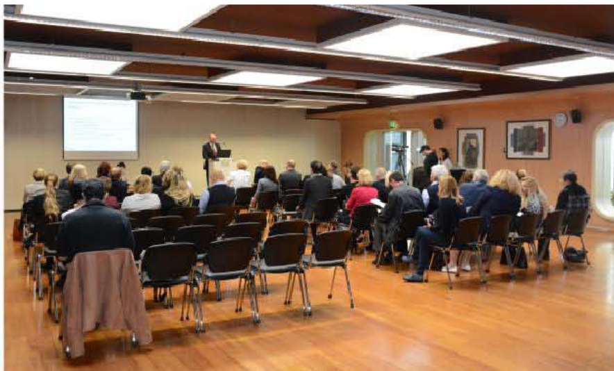
Problemska konferenca SKUPAJ - gradniki zdravja

V začetku novembra je Podjetniško trgovska zbornica pri GZS, v sodelovanju z Sindikatом obrti in podjetništva Slovenije in Sindikatом delavcev trgovine, organizirala problemsko konferenco v sklopu projekta »SKUPAJ – gradniki zdravja«, ki ga sofinancira Zavod za zdravstveno zavarovanje Slovenije. Konferenca, ki je potekala na Gospodarskem razstavišču v Ljubljani v sklopu sejma Narava – zdravje 2015, je opozorila na nujnost skupnih prizadevanj delodajalcev in zaposlenih v trgovinski, storitveni in proizvodni dejavnosti za večjo preventivo pred nastankom poklicnih bolezni. “Ob zaznavanju vsakdanjega stresa in pritiskov na delodajalce in delojemalce, ki jih ustvarjajo zaostrene razmere na trgu, se je treba zavedati nujnosti ukrepanja za izboljšanje razmer za zaposlene, sicer je lahko na daljši rok ogroženo zdravje zaposlenih, kar je za nadaljni razvoj podjetja vse prej kot dobro,” so zapisali organizatorji konference.