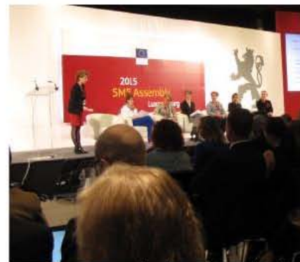
Zenske v svetu podjetništva

Zato je Evropska komisija oktobra letos že predstavila novo strategijo, ki naj bi okrepila in poglobila skupni evropski trg. To naj bi prineslo koristi v vsakodnevnem življenju ljudi in podjetij.