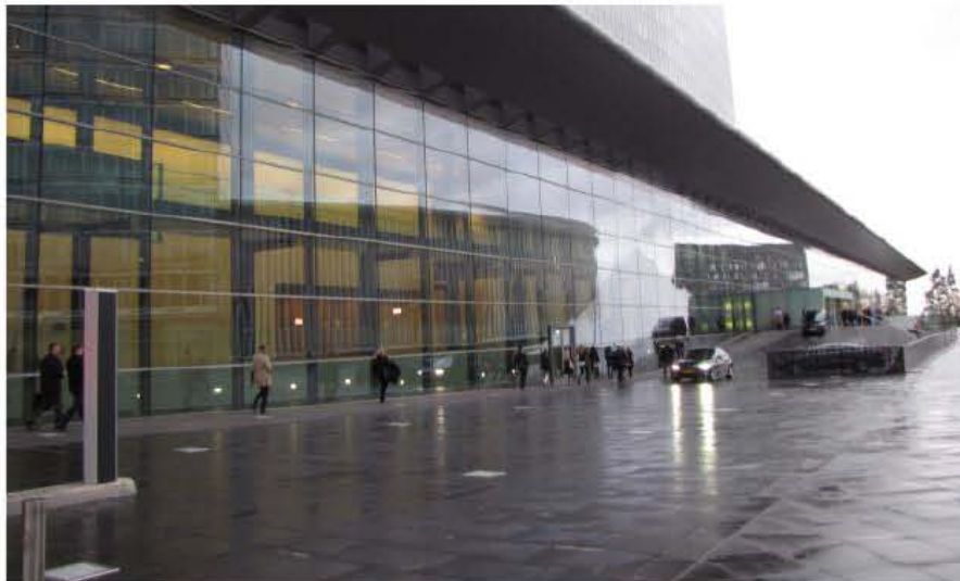
Palača Evrope Luxembourg

► Besedilo in fotografije: Vida Petrovčič