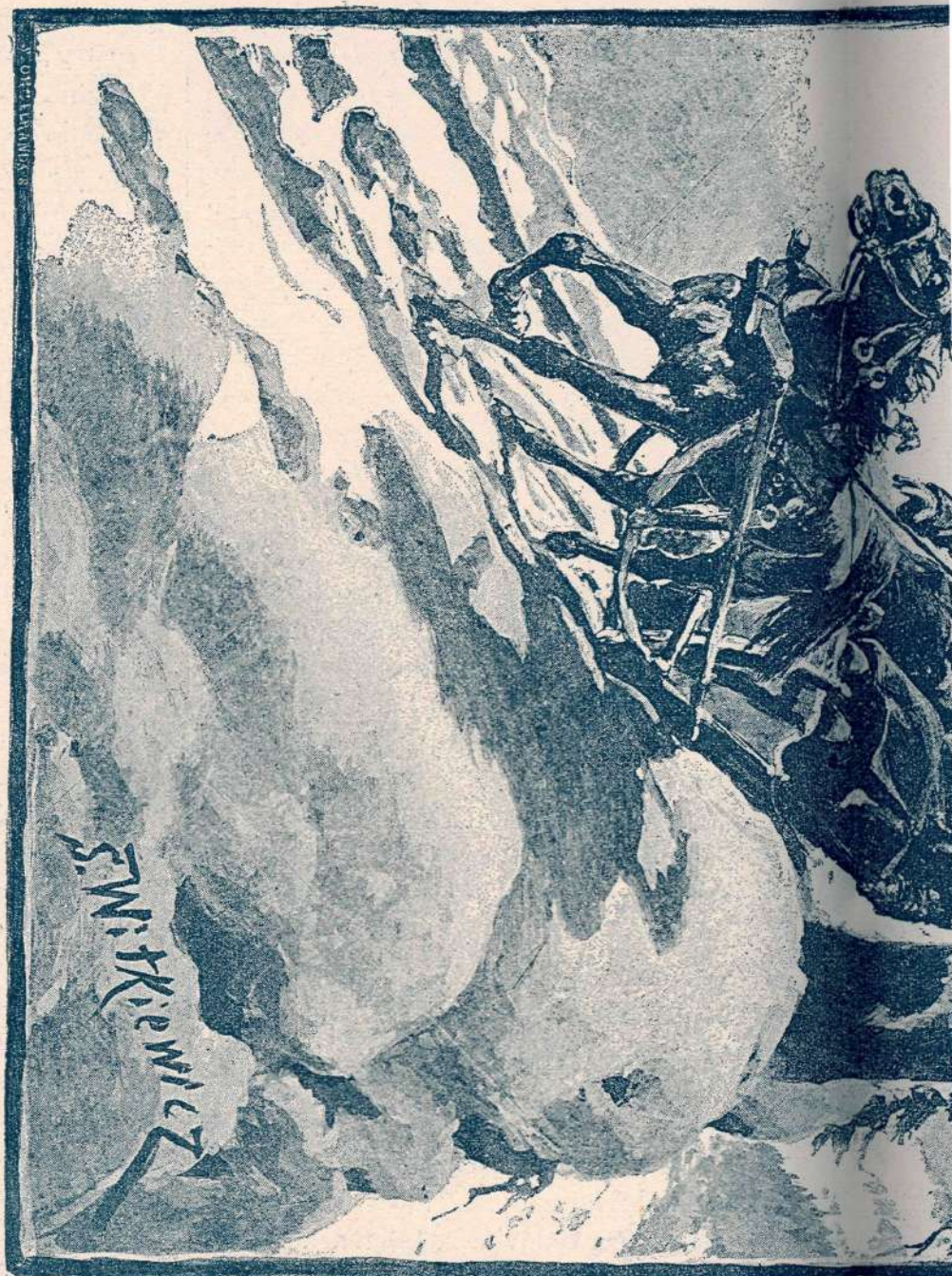
Zima v Tatrah.

kipí v nebo starodavna romanska cerkvice s tremi kapelami, ki stojé druga vrhu druge. Kar le pogledaš v tem svetišču, vse te spominja na silo davno preteklost: oblika kapel, stopnic, oltarji,