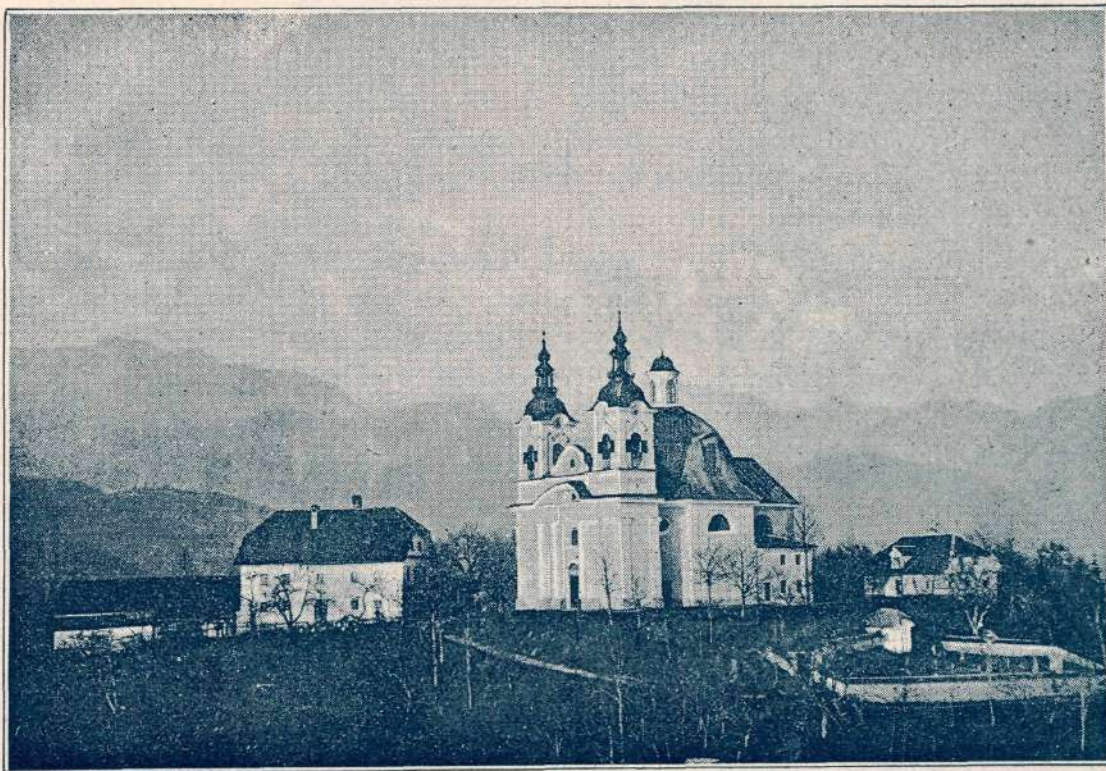
Tunjice. (Po fotografiji.)

v enoti in enote v mnogoličnosti, tolike neprisiljene prijetnosti in preproste zabave v tako ozkem okviru ne najdeš daleč na okoli. Potrtega duha ti razvedruje neizerpni zaklad kamniškega bajeslovja. Bajke o jezeru, o ajdovskem templju na Malem gradu, o enookem maliku v njem, o zmaju v bistriški dolini, o junaku Vrtomiru, o zakleti Veroniki itd. še sedaj živé med starimi ljudmi, a žal, s sedanjim rodom