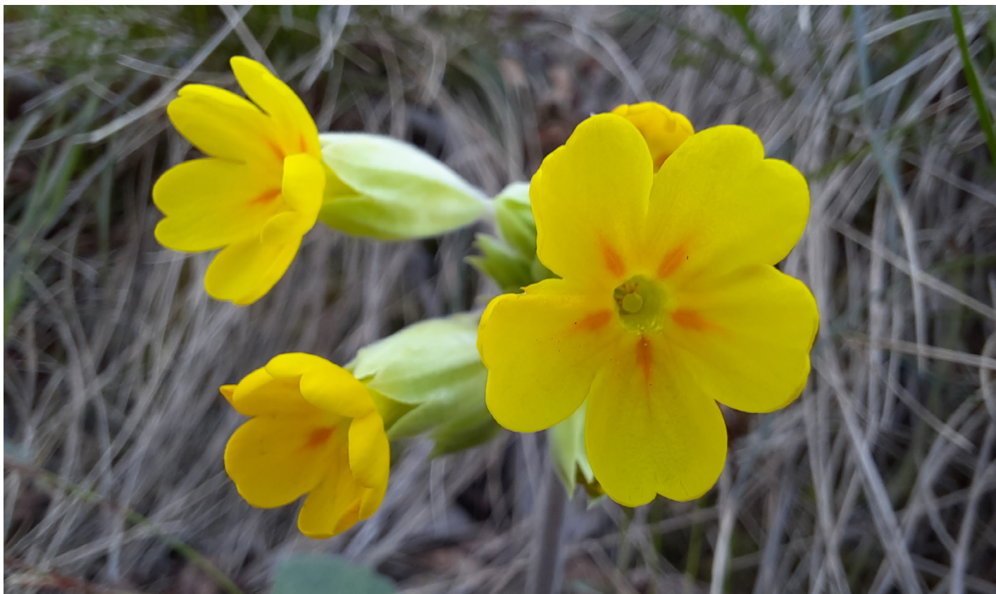
Pomladanski jeglič ( Primula veris ).

Eden izmed največjih čarov raziskovanja narave je v tem, da se največji čudeži ne skrivajo, temveč so prisotni prav pred našimi očmi, le pozorni moramo biti nanje. Ti mali čudeži narave pa v sebi pogosto skrivajo kompleksne razloge svojega obstoja. Charles Darwin bi znal o tem povedati marsikaj.