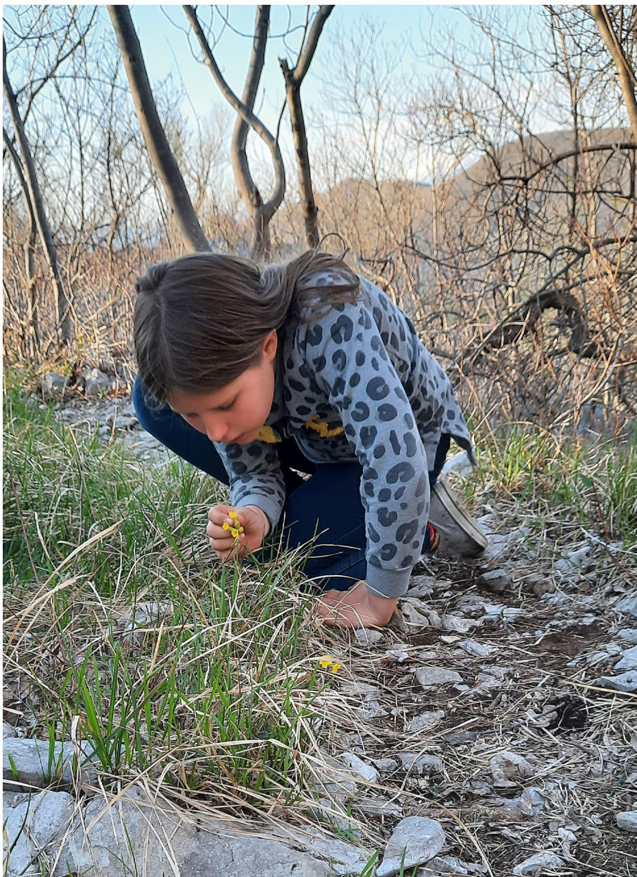
MLADI RAZISKOVALCI PRI ISKANJU POMLADANSKIH JEGLIČEV.