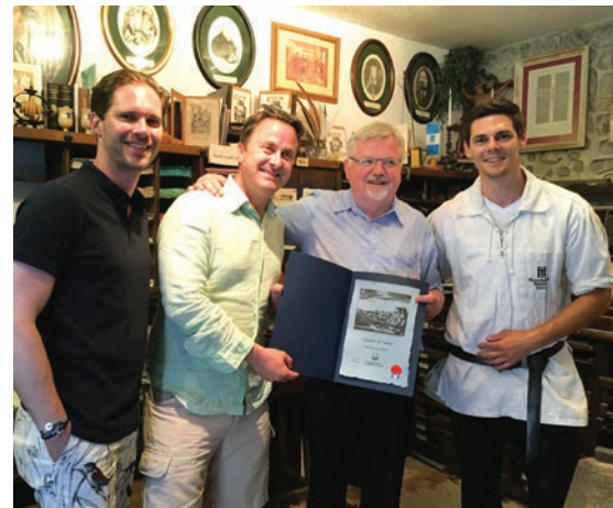
Predsednik vlade Velikega vojvodstva Luksemburga Xavier Bettel s soprogom v Grajski tiskarni.