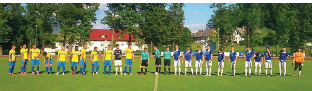
Pred zadnjo tekmo sezone 27.5.2017, Bled Hirter : AŠK Bravo Ljubljana (zmagovalec lige)