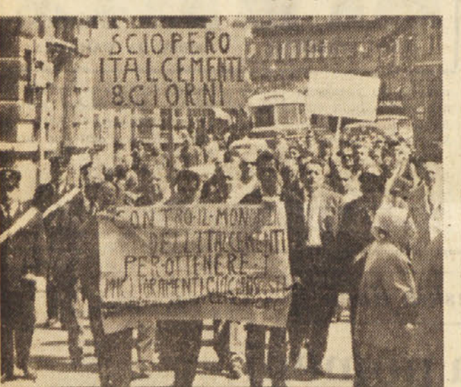
Ko so stavkajoči delavci Italcementi manifestirali po mestu, jih je prebivalstvo povsod pozdravljalo

Izletnike «Primorskega dnevnika» v Dalmacijo obveščamo: Danes popoldne ob 15. do 19. ure lahko dvignete bone, vozovnice in navodila za naš izlet v Dalmacijo, in sicer v Ul. Montecchi 6/II. Ce pa danes nimate časa, lahko izjemo dvignete v ponedeljek oziroma v torek med 9. in 13. uro. Izletnike, ki so se vpisali z osebnimi izkaznicami oziroma za skupni potni list, prosimo da prinesejo s sabo tudi 800 lir. Izletnik lahko dvigne bone, vozovnice in navodila tudi za svoje sosačane ali kolege, če je za to pooblaščen.