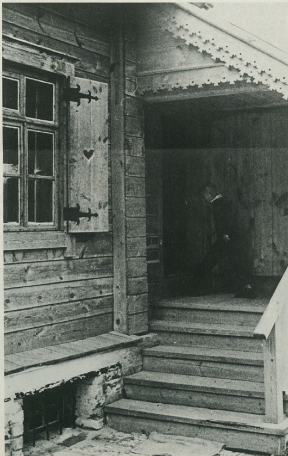
Podležska «izba», še danes tradicionalni dom kmečkega prebivalstva in simbol stare Rusije. V Komsomolsku, na Daljnem vzhodu je Gorbačev vzkliknil zbranim kmetom: «Ohranimo vendar stari način gradnje kmečkih domov. Čemu stolpnice na vasi?».

Za sedaj se vodi bitka za objavo Pasternaka in Anne Ahmatove v celoti, kar pomeni predvsem objavo «Doktorja Živaga». Konec koncev ni Pasternak nikoli spadal med disidente. Bil je žrtev samovolje v oceni svojega dela, sedaj pa je postal, po smrti, simbol boja proti Glavlitu, se pravi «literarni upravi», ki se ji po domače pravi cenzura. V SZ si ustvarjalci postavljajo ostro vprašanje