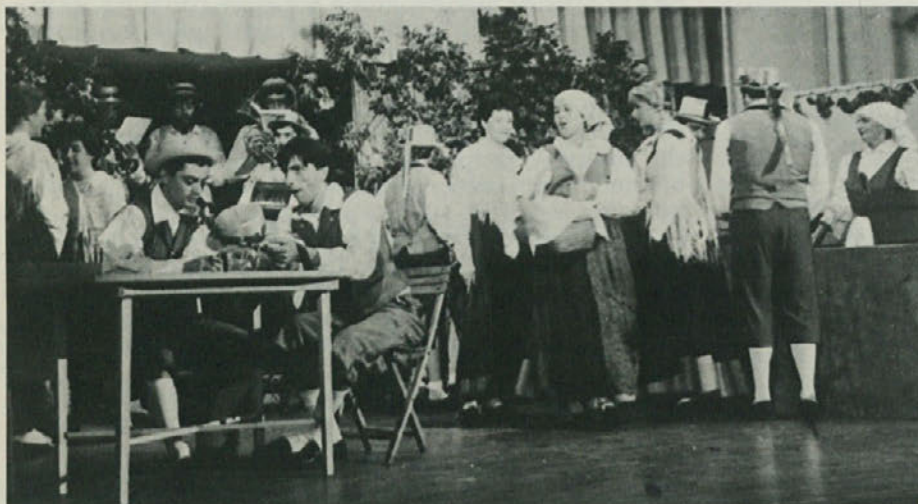
V nedeljo je na Proseku amaterski oder »Jaka Štoka« predstavil Pregarčevo veseloigro »Šagra«, v kateri nastopa 26 mladih igralcev, ki so z uspeho priredbo originalnega besedila v proseško narečje in posrečeno interpretacijo navdušili domače občinstvo.

Urniki: ob delavnikih: 16. - 20. — ob sobotah: 10. - 12.