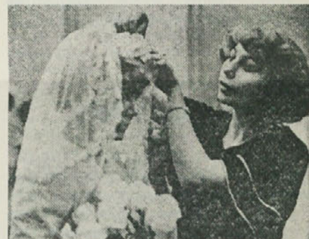
Avgustovska svatba. Gostje bodo vzklikali novoporočencema «gorko, gorko» (grenko) in zahtevali javen poljub, na koncu pa bo odmevalo staro voščilo: «Ljubezni in zdrave pameti, nič drugega ne potrebujete».

Avgust je v Rusiji mesec porok. Rusi so pač po svoji naravi kmečki narod, ki se je šele pred kratkim začel seliti v mesta, zato se še drži vseh starih kmečkih