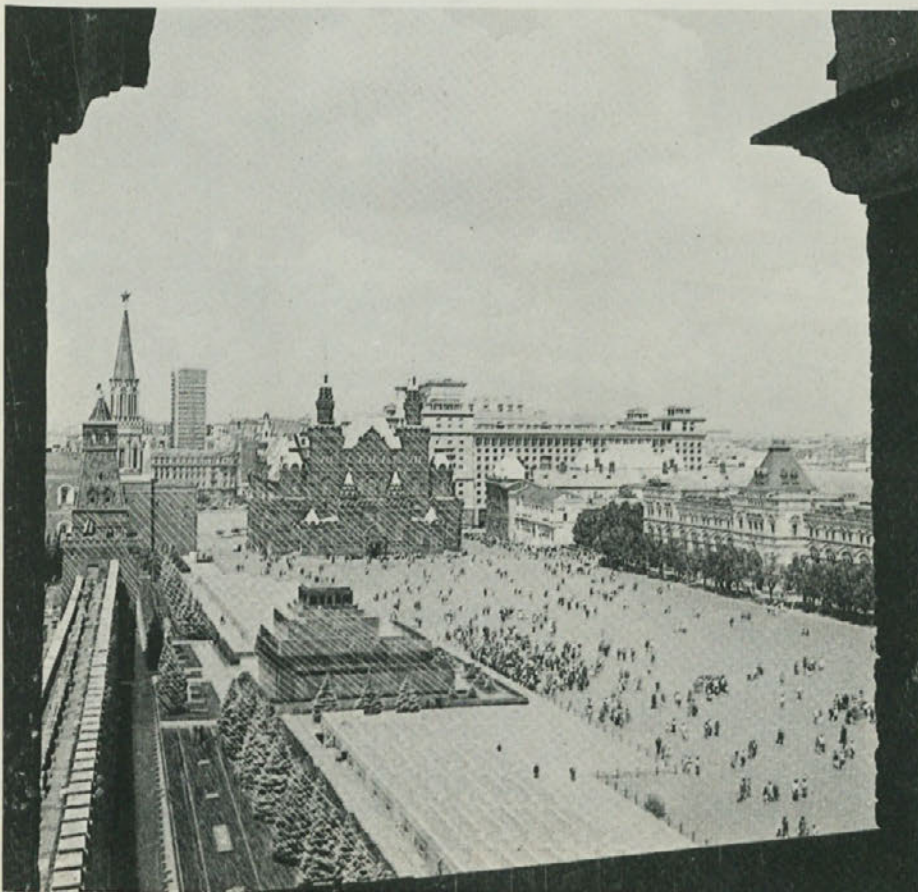
Pogled na moskovski Rdeči trg in Kremelj.

Drugi film, ki mi je ostal v spominu, je «Zmrznjena višnja», zgodba o mladi ženski, uradnici, ki se čuti osamljeno. Morda me je spomnila na ameriški film «Osamljena ženska» z Jill Claisburg, čeprav sta zaključka povsem različna. V tem primeru pa ne gre za ločenko. Mlada uradnica, ki je poleg vsega tudi čedna, se želi omožiti, kajti zanjo pomeni iskanje sreče predvsem uresničenje sanj o ljubezni v dvoje. Pri tem pa srečuje različne tipe. Od prijatelja, ki ji naravnost predlaga sožitje iz ekonomskih razlogov, pa si v resnici želi le dekle, ki bi mu stregla in prala nogavice, do mladega diplomata, ki jo očara s svoji-