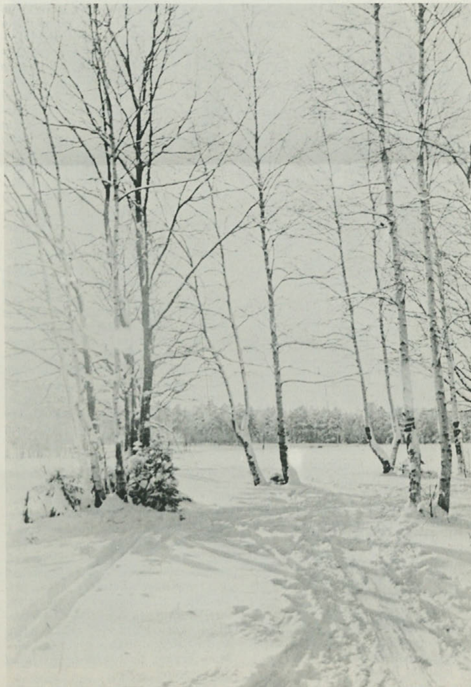
Zimska idila v brezovem gozdu.