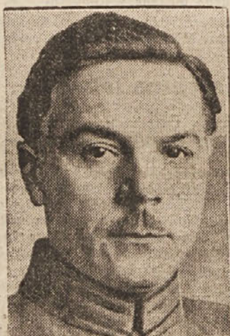
Imenovanje boljševičkih maršalov. Po odredbi osrednjega izvršnega odbora v Moskvi so bili na podlagi uvedbe starih carskih častniških činov v rdeči armadi imenovani prvi maršali Sovjetske Rusije. Mem njimi sta vojni komisar Vorosilov (na desni) in komandant armade na Daljnem Vzhodu Blücher (na levi).