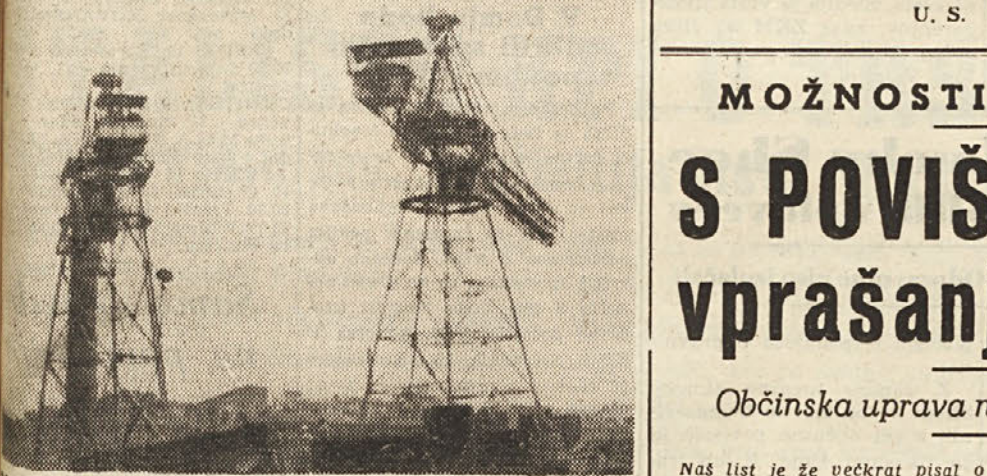
Naše ladjedelnice, ponos tržaskih delovnih ljudi ne delajo z svojo zmogljivostjo. Preli jim nevarnost popolnega uničenja.

Drugi strani je upravno delo pomorskih družb na zadnjem zborovanju ponovno povzelo javnosti in mestnemu občinstvu svetu nujnost in tendence pri merodajnih oblasteh, da to, da se čimprej do dodelitve ladjev na ladjedelnicah, da se napravi konec delobilizaciji tržaskih sedežev.