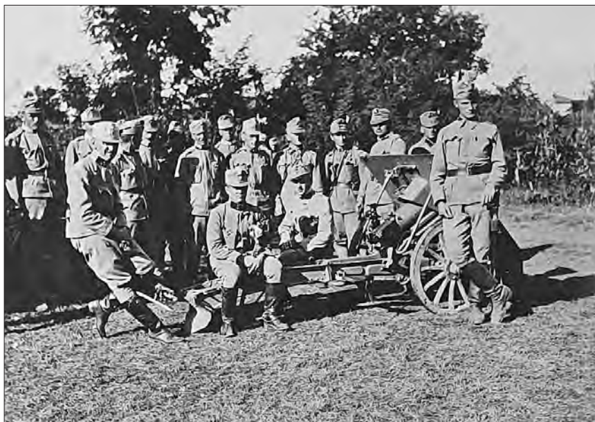
Častnik Adolf baron Samonigg (v ospredju levo) med prvo svetovno vojno.

bila pokopana na badenskem pokopališču. 167 Adolf Samonigg je umrl 3. novembra 1954. 168