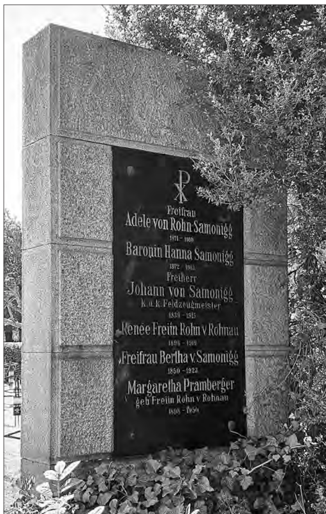
Samoniggova osmrtnica (StLA, Partezettelsammlung, K. 70, H. 5179) in njegov grob na pokopališču v Badnu.