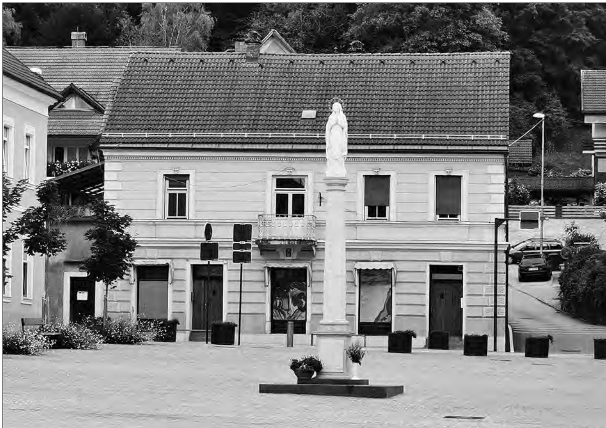
Samoniggova hiša v Šoštanju.

Johann, ki je bil krščen na sveti večer, 24. decembra 1839. 19