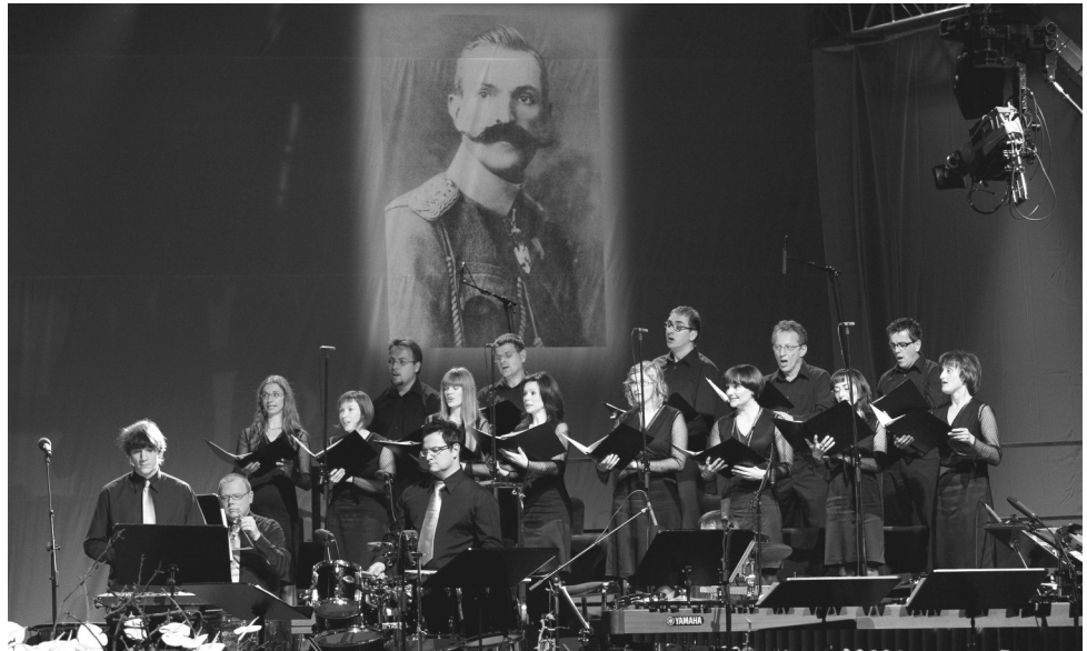
Komorni zbor KUD Markovski zvon med nastopom na državni proslavi ob dnevu Rudolfa Maistra

Ob koncu ne smemo pozabiti na tradicionalni božični koncert našega društva ob koncu meseca. Ta predstavlja vrh letošnjega dela,