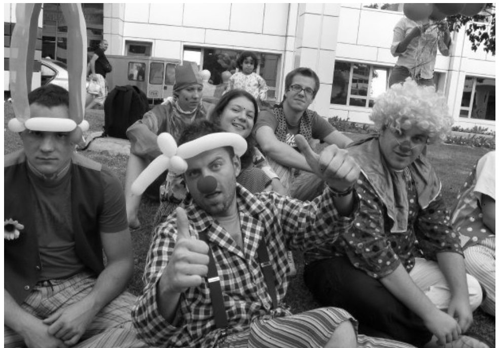
Zares Aktivni so poskušali v klovnovi opravi razveseliti otroke v bolnišnicah.

Klub mladih Zares Aktivni je podmladek politične stranke Zares - nova politika. V občini Markovci še ni ustanovljenega občinskega odbora Zares - nova politika in ob tej priložnosti bi pozval vse občane, ki jih zanima lokalna problematika občine Markovci in politika na