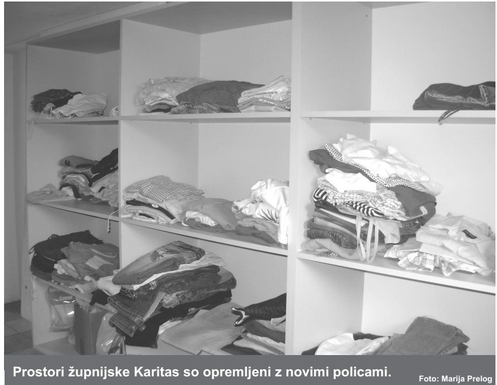
Prostori župnijske Karitas so opremljeni z novimi policami.

Tako smo v mesecu oktobru bili gostitelji srečanja sodelavcev dekanije Ptuj in Zavrč. Ta srečanja potekajo vsak drugi torek v mesecu v drugi župniji. Izmenjujemo si mnenja in poročamo o potrebah pomoči, ki jo potrebuje katera župnija, zraven pa seveda sodi tudi duhovna misel, ki jo poda domači župnik. Več kot zadovoljivo so sodelavci poročali o sodelovanju z Rdečim križem ob reševanju posledic toče, kjer je bilo potrebno pravično razdeliti finančno pomoč ljudem, ki so bili prizadeti. Naši župniki hvala Bogu, je bilo prizanešeno, vendar smo ravno tako pomagali z zbiranjem kmetijskih pridelkov, ki jih nismo poslali v semenišče, ampak ljudem, ki jim je to prišlo še kako prav. V tem zimskem času pa je tudi precej prošelj za sofinanciranje plačila kurjave. Pri nas smo dokončno opremili sobo s policami, tako da ljudje, ko pridejo iskat obleko ali kaj drugega, lahko hitro najdejo kaj primerne zase. V sodelovanju z OORK pa smo razdelili tudi pomoč v obliki donacije EU. Ne smemo pozabiti, da, v kolikor nam čas dopušča, obiščemo naše farane v domovih starejših. Razveselili pa smo se tudi nove sodelavke, saj smo resnično veseli vsakega novega človeka, ki v srcu začuti, da sme na ta način pomagati ljudem. Naša Karitas se je vključila tudi v priprave dobrodelnega koncerta Karitas, ki tradicionalno poteka v župniji sv. Petra in Pavla na Ptuj in je vsako leto množično obiskan. Zbrana finančna sredstva pa se bodo še vedno koristila za ljudi, prizadete v toči.