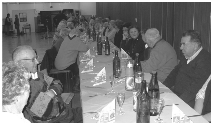
Decembra so se srečali starejši občani nad 70 let.