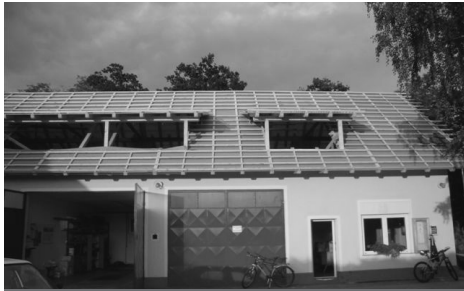
Gasilski dom med obnovo ostrešja

Letošnje leto so se v gasilskem društvu Stojnci zgodile velike spremembe. Najprej smo na redni letni konferenci izpeljali volitve.