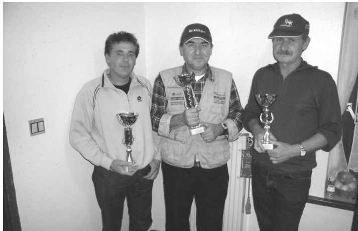
Najboljši z drugega ribiškega tekmovanja za pokal vasi Stojnci

Bo že držalo, da smo Stojnčani aktivni skozi vse leto. Še ni dolgo, ko smo bili na »fašenskem« izletu. Sledil je vaški piknik, potem še »krompirjarda« in še kaj.