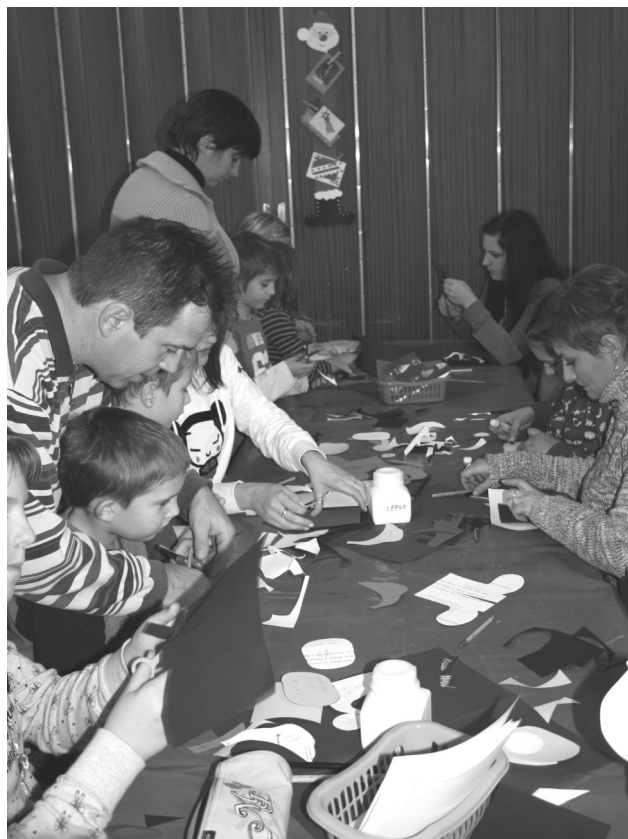
Otroci so ustvarjali v družbi svojih staršev.

Ta izdelek pa so lahko koristno uporabili že takoj po koncu delavnice, saj so v jelenčkovo vrečko pospravili narejene izdelke in jih odnesli domov. Pri postopku izdelave sva