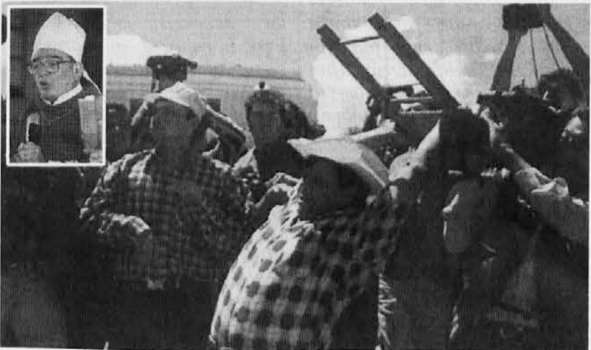
Napadalci grozijo somišljenikom škofa Ruiza, ki ga vidimo na mali sliki

Mednarodna javnost s pozornostjo spremlja to, kar se dogaja v Mehiki. V ponedeljek je okrog 500 latifundistov in trgovcev obkloplilo stolnico sv. Cristobala de las Casas v glavnem mestu Chiapas-a in se spoprijelo z Indios, ki so branili svojo cerkev. Demonstrantje so imeli na transparentih naslikanega krajevnega škofa kot hudiča. Pred demonstranti je bilo na tisoče domačinov, med katerimi mnogo žensk, otrok in ostarelih, ki so