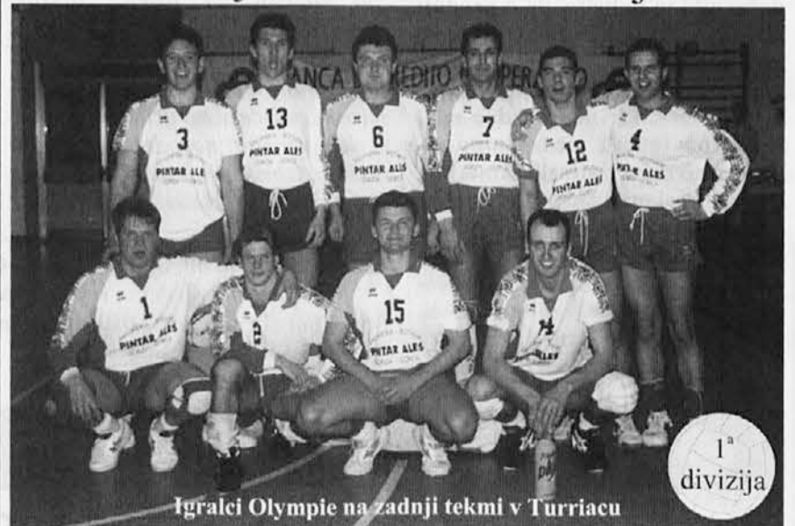
Igralci Olympie na zadnji tekmi v Turriacu