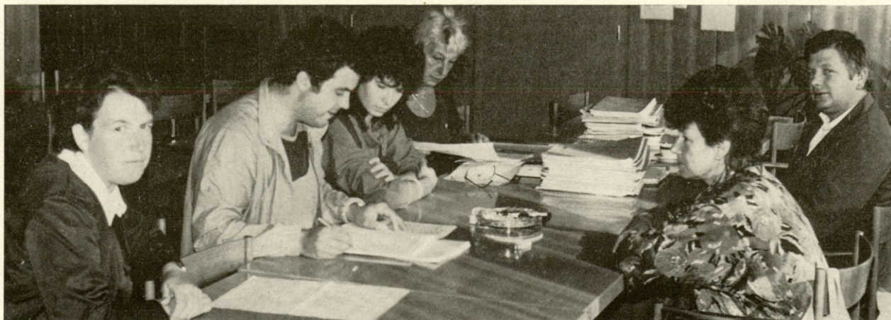
Takole resni so bili delegati komisije za reševanje stanovanjskih potreb delavcev v naši DO, ko so pregledovali prispеле vloge na razpis natečaja za uvrstitev na prednostno listo za dodelitev stanovanjskih posojil