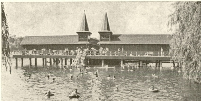
Zanimivost z Madžarske. Čudovita stavba na koleh. Voda, ki jo odbaja, je termalnega izvora in zelo topla, zato se je marsikateri »financarka« v njej tudi okopala. Motiv je iz okolice Blatnega jezera