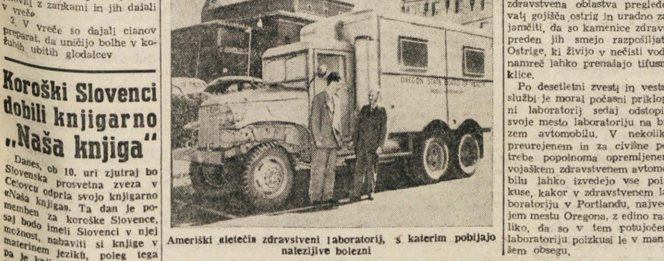
Ameriški aletični zdravstveni laboratorij, s katerim pobljajo nalezljive bolezni