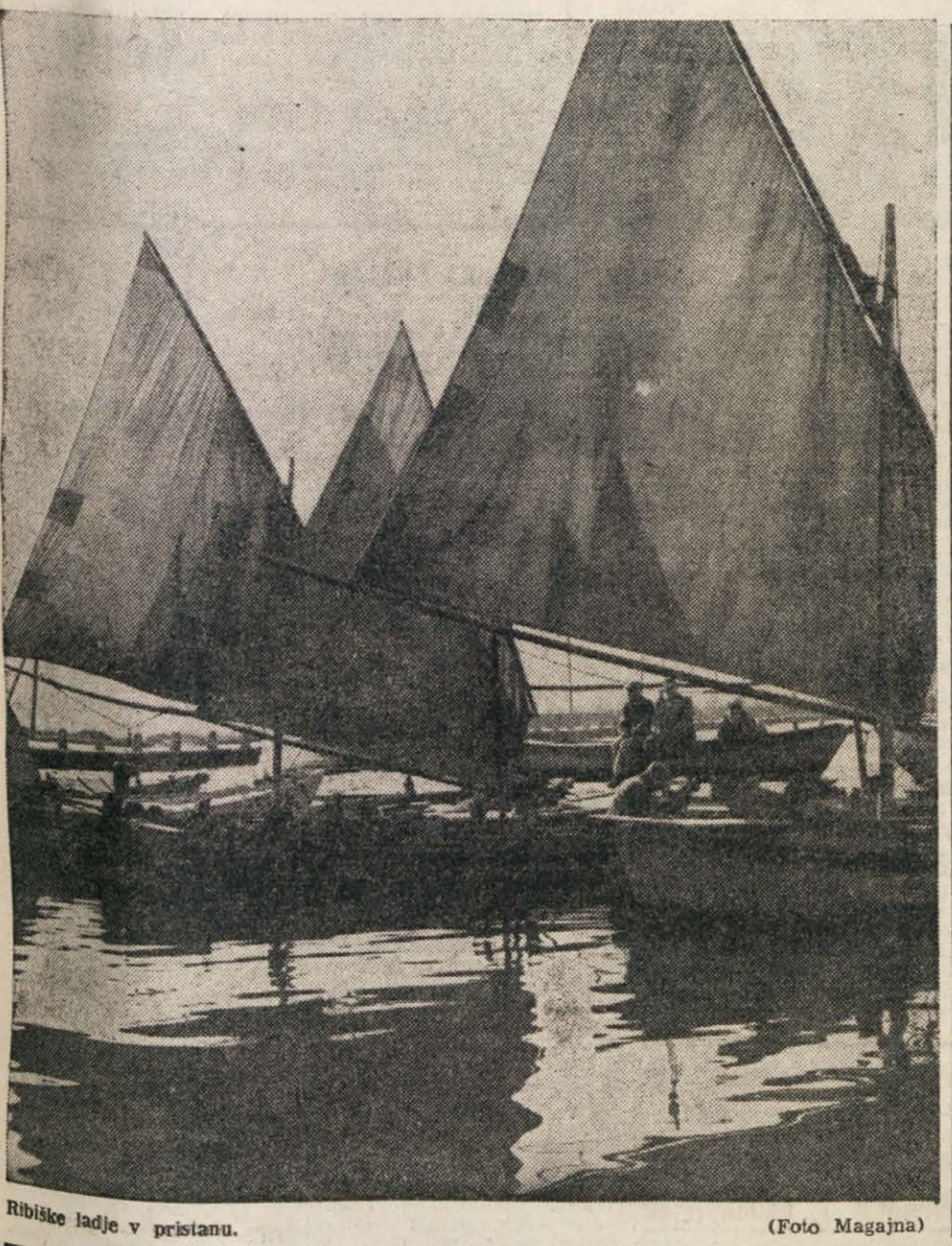
Ribiške ladje v pristani.