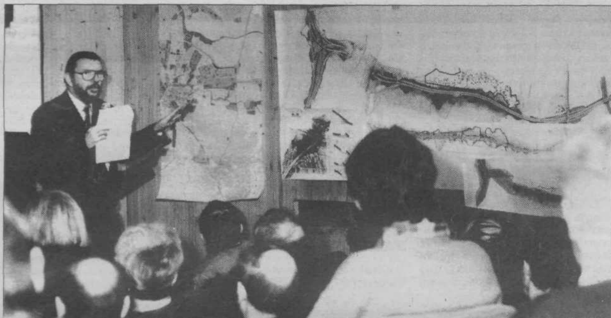
Seje občinske skupščine so se udeležili tudi ugledni predstavniki projektantskih in drugih institucij, povezanih z gradnjo avtoceste in severne obvoznice.

Razprava se je začela z rahlim strankarskim preigravanjem in se usmerila v povsem konkretna vprašanja, pobude in pripombe. Z odgovori predlagatelja je bil najbolj nezadovo-