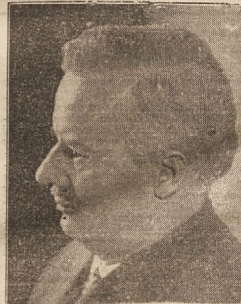
Profesor Spemann je prejel Nobelovo nagrado. — Proforski zbor Karolinškega zavoda v Stockholmu je priznal letošnjo Nobelovo nagrado za fiziologijo in medicino nemškemu profesorju Hansu Spemannu-Freiburg. Ucenjak je odkril tvorni učinek za časa embrionalnega razvoja. Znanstvenik je star 66 let in se je 30 let bavil s tem vprašanjem. Pri tem je prišel do pomembnega spoznanja, da kali raznih organizmov po presaditvi ohranijo svoje prvotne funkcijske sposobnosti.

Po mnenju poročevalca stockholmskega lista »Afton Bladet« bo švedska akademija že prihodnje dni podelila Nobelovo nagrado za književnost. Najresnejši kandidat je baje francoski pesnik Paul Valery.