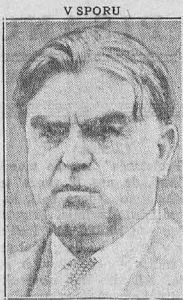
John L. Lewis, načelnik premožarske unije, ki je pred nekaj dnevi resigniral z mesta podpredsednika Ameriške delavske federacije in je objavil, da se bo boril za preureditev sistema v organizaciji.

vini ropal in moral Turek in je v potokih teklo slovenske krvi in solz! Kaj je bila takrat slovenskemu narodu Stična, to nam je že genljivo naslikalo večje pero naših pisateljev. Stična je neumorno građila od vpada do vpada svoje močno turško obzidje in stolpe, kar je še danes ohranjeno, ter nudila varno zavetišče ožji in širši okolici. Pa še več! Stična je v obrambo domačega ljudstva zidala trdnjavski stolp že doli pri Novem mestu.