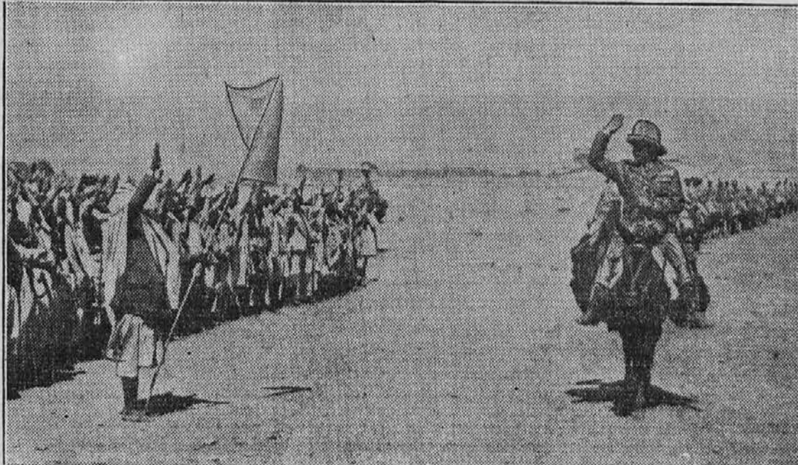
Prebivalstvo mesta Makale v Abesiniji se je mirno predalo Italijanom, ker jim pač nič drugega ni preostajalo. Tako vidimo na gornji sliki na levi skupino meščanov, ki so prišli pozdraviti italijansko vojsko. Kakor kaže, so se že prej naučili fašističnega pozdrava.