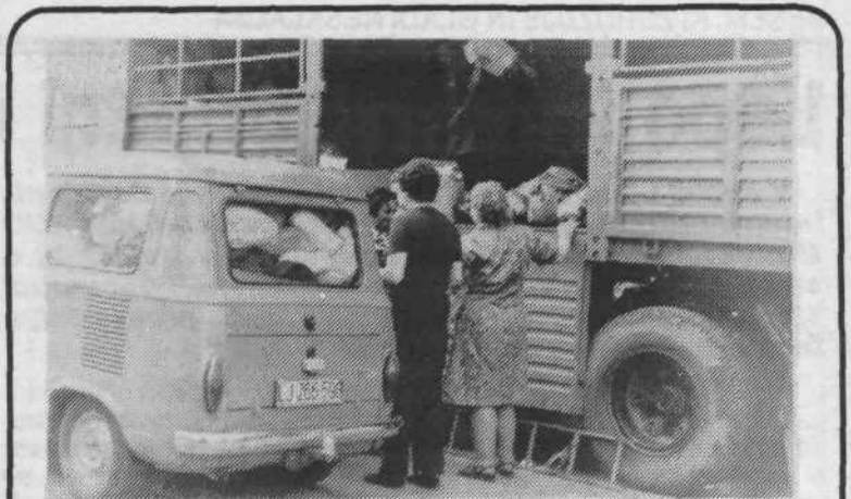
Akcija Rdečega križa za zbiranje starih oblačil je v Centru povsem uspela