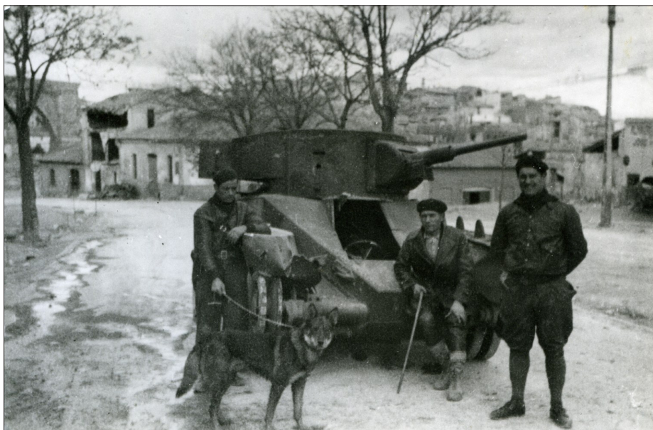
Pes Džulbars – najzvestejši prijatelj S. Furlana na španski fronti.

Seveda sem demokrat, tudi komunist po prepričanju. Zdaj ljudje govorijo o komunistih vse najslabše. Razumljivo, zato nisem nikoli postal član partije. Deloval sem z vsemi vrstami ljudi, z nikomer se nisem skregal, kaj šele, da bi kogarkoli