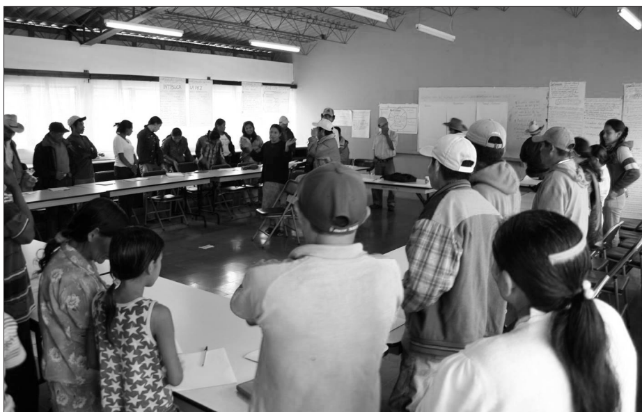
Izobraževalni posvet COPINH.

Berta je v organizaciji COPINH in med lenkovskimi skupnostmi, s katerimi je delovala, uveljavljala Freirejevo pedagogiko zatiranih (Freire, 2000/1972) kot tudi druge kritične pedagoške pristope, ki so prerasli v transformativno in kritično pedagogiko samodoločujočih skupnosti. Ta je vključevala ne le vzajemno, dialoško in horizontalno kritično učenje in polnomočenje, pač pa tudi vzajemno soraziskovanje ( militancia de investigación ) med skupnostmi, med skupinami, med spoli, med ženskami, med utišanimi, med zatiranimi itn. Ta dvojni in vzajemni proces – na eni strani »učee se učenje« in »proizvajajoče se učenje«, kot ju je pojmoval Freire (2000/1972) in na drugi strani militantno soraziskovanje, kot ga denimo