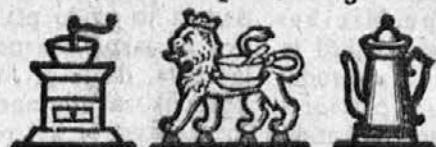
Tovarn. znamka. — Tovarn. znamka. — Tovarn. znamka. sl. K 427. 1910 II. V.

da imate jamstvo za vedno jednako in najboljšo kakovost. — Pazite pri tem na varstvene znamke in podpis, kajti naše zamotanje se v enakih barvah, papirju in z podobnim natisom ponareja. —