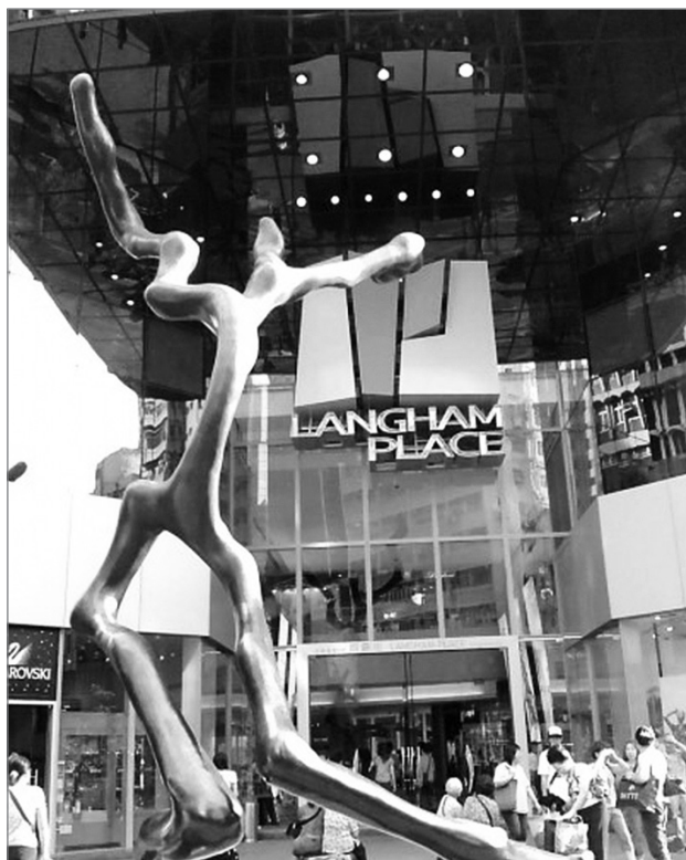
Slika 2: Vhod v nakupovalno središče Langham Place na križišču ulic Argyle in Portland

januarja 1991. Prvotno je družba za prostorski razvoj (ang. Land Development Corporation ) [1] nameravala projekt končati do leta 1998, vendar pa ga je zaradi enajstletnega spora glede združevanja zemljišč končno prevzel njen naslednik, URA. Na združeni lokaciji so na koncu v skupnem partnerstvu med podjetjem Great Eagle Holdings Limited in URA zgradili poslovni kompleks z 58-nadstropno poslovno stolpnico, 41-nadstropnim hotelom (s 495 sobami) in s 15-etažnim nakupovalnim središčem na približno 56.000 m 2 prodajnih površin. Projekt je bil leta 2003 uradno poimenovan Langham Place, nove prostore pa so odprli konec leta 2004. [2] Leta 2005 je podjetje Great Eagle odkupilo 50-odstotni delež, ki je pripadal URA, in s tem postalo edini lastnik projekta. Sliki 1 in 2 prikazujeta kompleks Langham Place, kot ga lahko vidimo danes, njegova lokacija pa je prikazana na sliki 3.