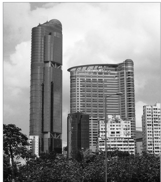
Slika 1: Pogled na kompleks Langham Place z zahodne strani

Projekt celovite sanacije, na katerega se osredotoča ta študija, poteka na ulicah Argyle in Šanghaj, ki se nahajata na najboljši lokaciji v predelu Mongkok na polotoku Kowloon. Projekt ima dolgo zgodovino. Med pripravo osnutka načrta namenske rabe zemljišč za Mongkok aprila 1988 so predlagali, da bi morala biti projektna lokacija območje celovitega razvoja (ang. Comprehensive Development Area , v nadaljevanju: CDA). Na tem območju je bilo takrat veliko propadajočih stavb, območje pa je bilo označeno kot »rdeča četrt«, saj je bilo tam veliko prostitutk, ki so delale kar v svojih stanovanjih (Emerton, 2001; Liu in Lau, 2006). Mestni načrtovalski odbor je načrt za razvojno območje na ulicah Argyle in Šanghaj odobril