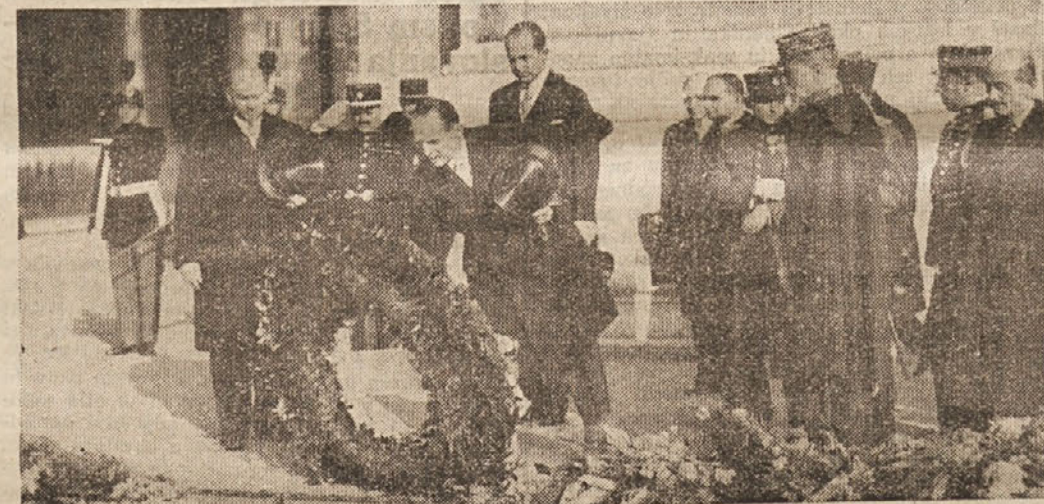
Na svojem povratku v Grčijo se je kralj Jurij II. ustavil tudi v Parizu. Obiskal je predsednika francoske republike Lebruna in položil venec na grob Neznanelega junaka, kar kaže naša slika

Prepovem vam, da bi mi dajali nasvete, odgovori Desbons. Spet je padla beseda »manevri« in državni tožilec je namignil na do-