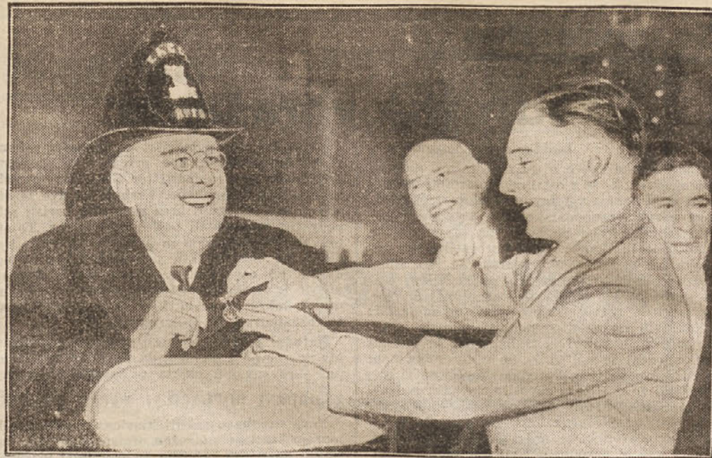
Francoski obilni gasilci v Newyorku so izvolili predsednika Roosevelta za svojega častnega člana. Tudi ob tej priliki Roosevelt ni štedil z dobro voljo in na glavo si je dal celo gasilsko čelado