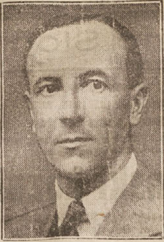
Profesor James Chadwick, ki je dobil letošjo Nobelovo nagrado za fiziko. Odkril je neutron. Deluje pa na univerzi v Liverpoolu