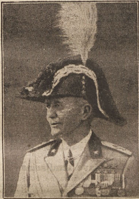
Šef italijanskega generalnega štaba Badoglio, ki je prevzel vrhovno poveljništvo nad italijansko armado v Abesiniji