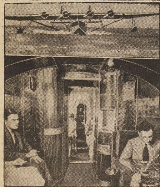
Zgoraj pristaja orjaško luksuzno ekspresno letalo, v katerem je prostora za 43 potnike in katero vrši letalsko potniško službo med zapadno obalo Amerike in Kitajske. Spodaj pogled v kabino za potnike

Nastalo je prerekanje med državnim tožilcem in odvetnikom, ki vzklikne: