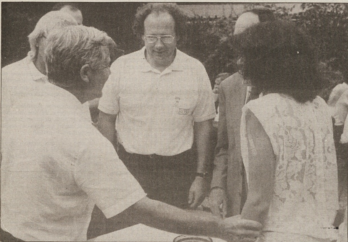
Lepo se je sončiti v slavi, to ve vsak politik