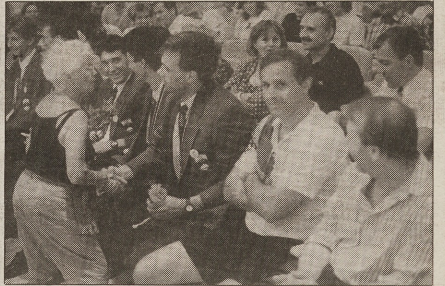
Pušeljce pač mora bit