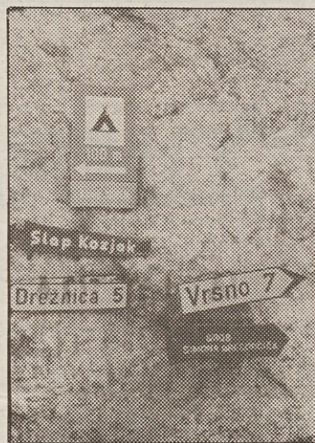
Kam? Odločitev ne bo lahka, saj je v dolini Soče kaj videti

Še in še bi lahko naštevali turistično ponudbo Bovca in njegove okolice. Bolj kot to pa je vsekakor spodbudna ugotovitev, da gostom tu ni potrebno prodajati dolgega časa. In da so zadovoljni. Očitno precej bolj kot marsikje drugje, kjer malo nudijo, zato pa toliko bolj »spretno« odirajo.