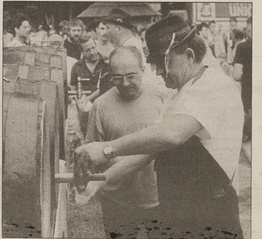
...pivo pa žejo