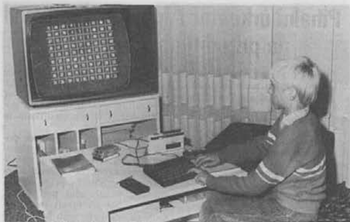
Z računalniki delajo lahko že desetletni otroci