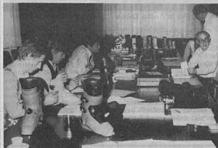
Živahna razprava, ugodne ocene in tudi kritične pripombe naših kupcev ob predstavitvi kolekcije zimsko športne obutve