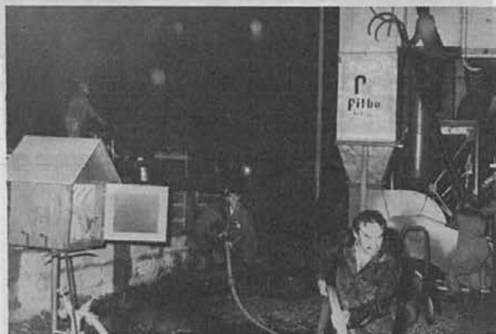
Takole so se gašenja lotili gasilci

Tudi po zaslugi Turističnega društva Žiri in seveda Žirovcev samih so bile Žiri letos ocenjene kot tretji najlepše urejen kraj na Gorenjskem