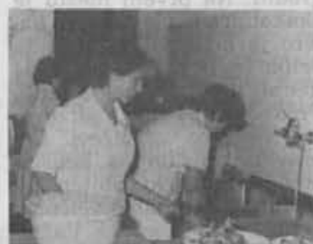
Nekaj zadreg v ne povsem opremljeni kuhinji