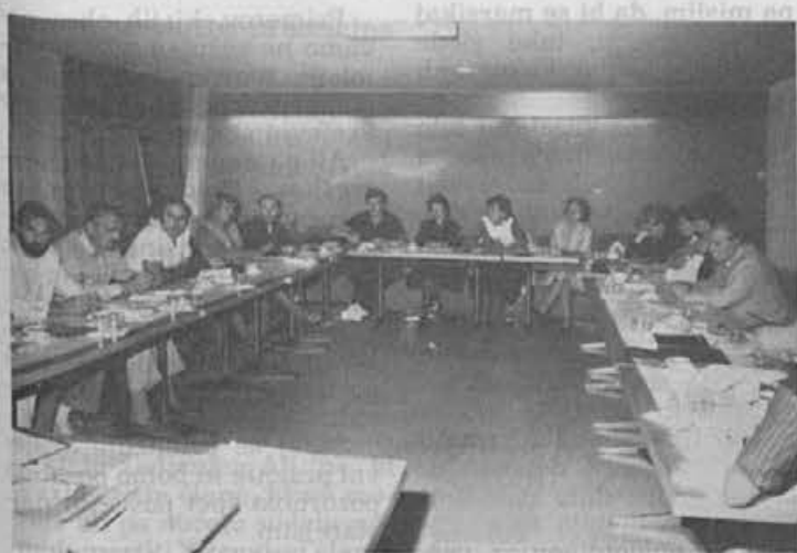
Z razprave v drugem rajonu