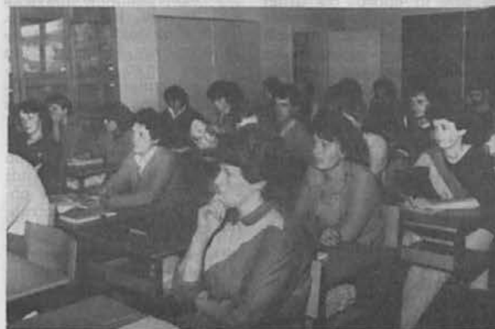
Skrbi je veliko, če bo dosti volje, bo šlo!