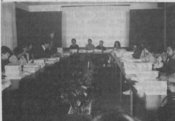
Prvi napotki slušateljem

Pot do končnega cilja je še dolga, toda ob sodelovanju vseh in sprotne delu uspeh ne bi smel izostati.