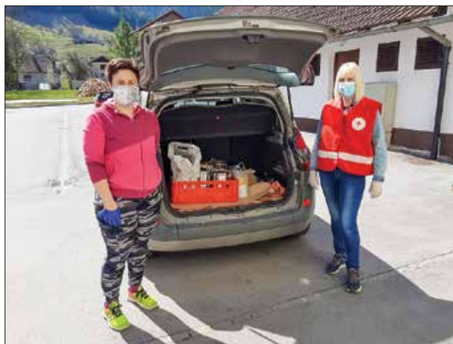
Prostovoljke KORK Gornji Grad pri razvažanju toplih obrokov starejšim krajanom.