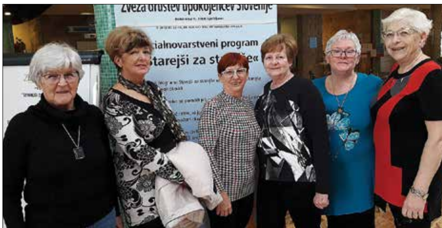
Zgornjesavinjske udeleženke strokovnega srečanja v projektu Starejši za starejše v Izoli

Cilj programa Starejši za starejše, ki ga izvajajo v več kot 300 društvih upokojencev po