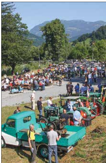
Na 13. mednarodno srečanje starodobnikov so prišli udeleženci iz petih držav: Slovenije, Avstrije, Hrvaške, Nemčije in Švedske.