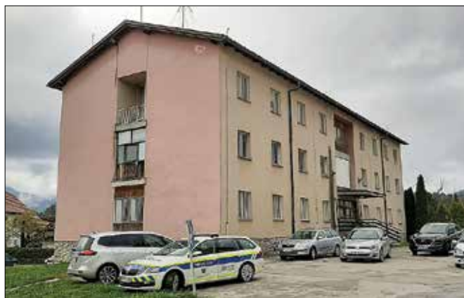
Konstrukcija stavbe ostane, dvignili jo bodo za eno etažo, zamenjali streho in potem začeli gradnjo v notranjosti.

do največ trisobna, a manjših kvadratur – med 55 in 70 kvadratnih metrov. To ne bodo nadstandardna stanovanja, ampak po večini prva samostojna stanovanja za mlade. Vsa stanovanja bodo imela balkon, parkirišč bo dovolj, v stavbi bo tudi dvigalo.