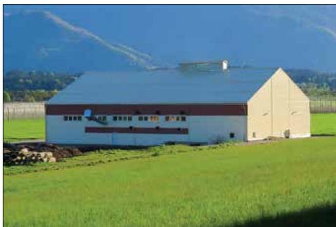
Na območju rečiških hmeljišč so pred časom izvedli investicijo v objekte in opremo.