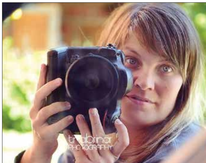
Iz varnostnih razlogov se je fotografinja Tina Brinar odločila, da bo celoten projekt izpeljala brez fizičnih stikov.

dani projekt? Tina Brinar: »Malo zato, da bodo ljudje imeli spomin na res posebno obdobje njihovega življenja, malo pa tudi zato, da prekinemo to monotonost in da bodo imeli razlog, da se spravi-jo iz pižam.«