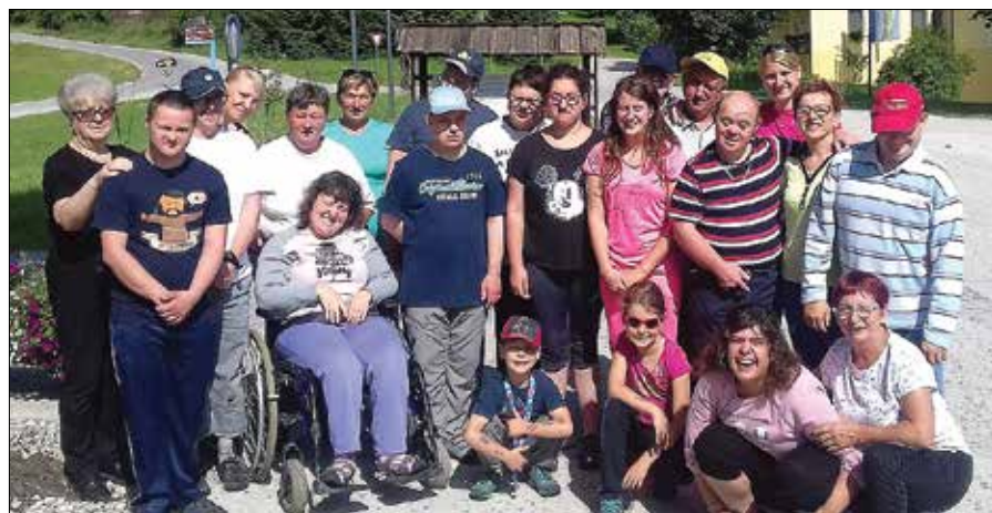
Članom društva je skupno veselje do druženja in aktivnega preživljanja časa. (Fotodokumentacija Sožitja)