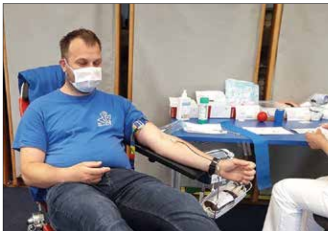
Na krvodajalske akcije vabijo samo krvodajalce tistih krvnih skupin, ki jih potrebujejo.

Ena izmed organizacij, ki pomaga socialno ali zdravstveno ogroženim skozi vse leto, zelo pa tudi v času epidemije, je Rdeči križ (RK) Slovenije. Njegovi prostovoljci so razpršeni po vsej državi, v naši dolini pod okriljem Območnega združenja (OZ) RK Zgornje Savinjske