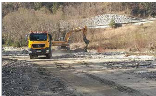
Odstranjevanje naplavljenega gramoz iz struge Savinje

Za uresničitev projekta je bilo najprej potrebno pridobiti strokovno študijo, na podlagi katere je Zavod RS za varstvo narave podal strokovno mnenje s presojo vplivov na okolje, Direkcija RS za vode pa vodno soglasje. Konec februarja je občina na podlagi omenjenih dokumentov od Uprave enote Mozirje pridobila še odločbo, nato so