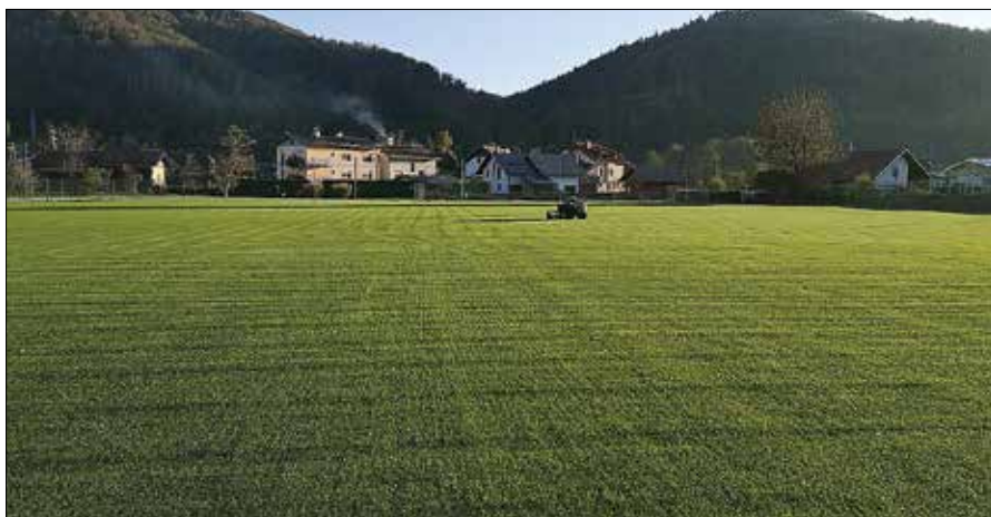
Popolnoma novo pomožno igrišče je v ponos vsem ljubiteljem nogometa v Mozirju.