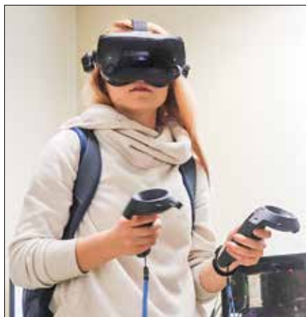
Na univerzi Fresno v Kaliforniji so si obiskovalci iz Maribora skozi VR očala ogledali virtualno resničnost.

Možnost ekskurzije ni na voljo vsako leto. Zadnji podoben obisk so njihovi kolegi opravili v letu 2011. Na pot se je tokrat podalo 20 študentov z dvema profesorjema. 10. februarja so po vožnji iz Maribora z dunajskega letališča poleteli čez veliko lužo, nad oblaki so do cilja preživeli kar 12 ur.