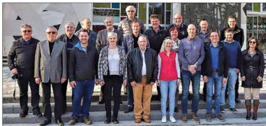
Društvo varnostnih inženirjev Velenje ob 40-letnici delovanja

Sodelovanje se je obrestovalo tudi z gospo-