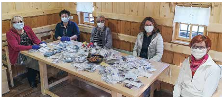
Na Ljubnem ob Savinji so se prostovoljke krajevnega odbora Rdečega križa lotile šivanja kvalitetnih pralnih mask in že v treh dneh sešile večjo količino.