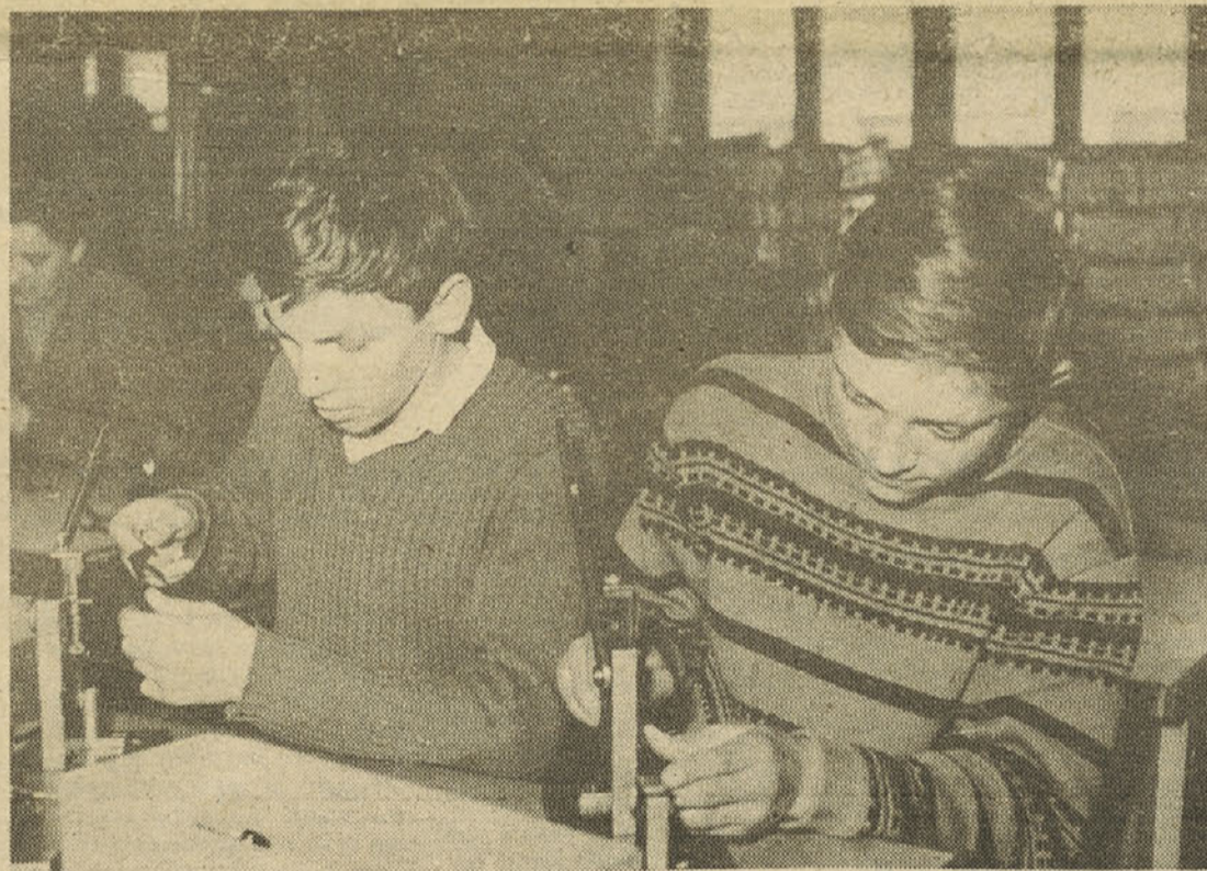
Pri praktičnem delu v tovarni

ki so značilne za šolske reforme na vzhodu in zahodu. Samoupravna preobrazba vzgoje in izobraževanja je v tem del širše družbene preobrazbe, ki poteka pri nas.