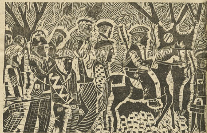
Ilios Vilos (14 let): V pričakovanju sovražnika, Osnovna šola Kiril Metod, Bitola

Prijave z ustreznimi dokazili o izobrazbi pošljite v 15 dneh po objavi razpisa na naslov: Srednja pomorska in prometna šola Portorož, Pomorščakov 4.