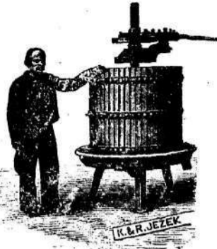
K. & R. JEZEK

Velika izber raznovrstnih klobukov. Cene zmerne blago prve vrste.